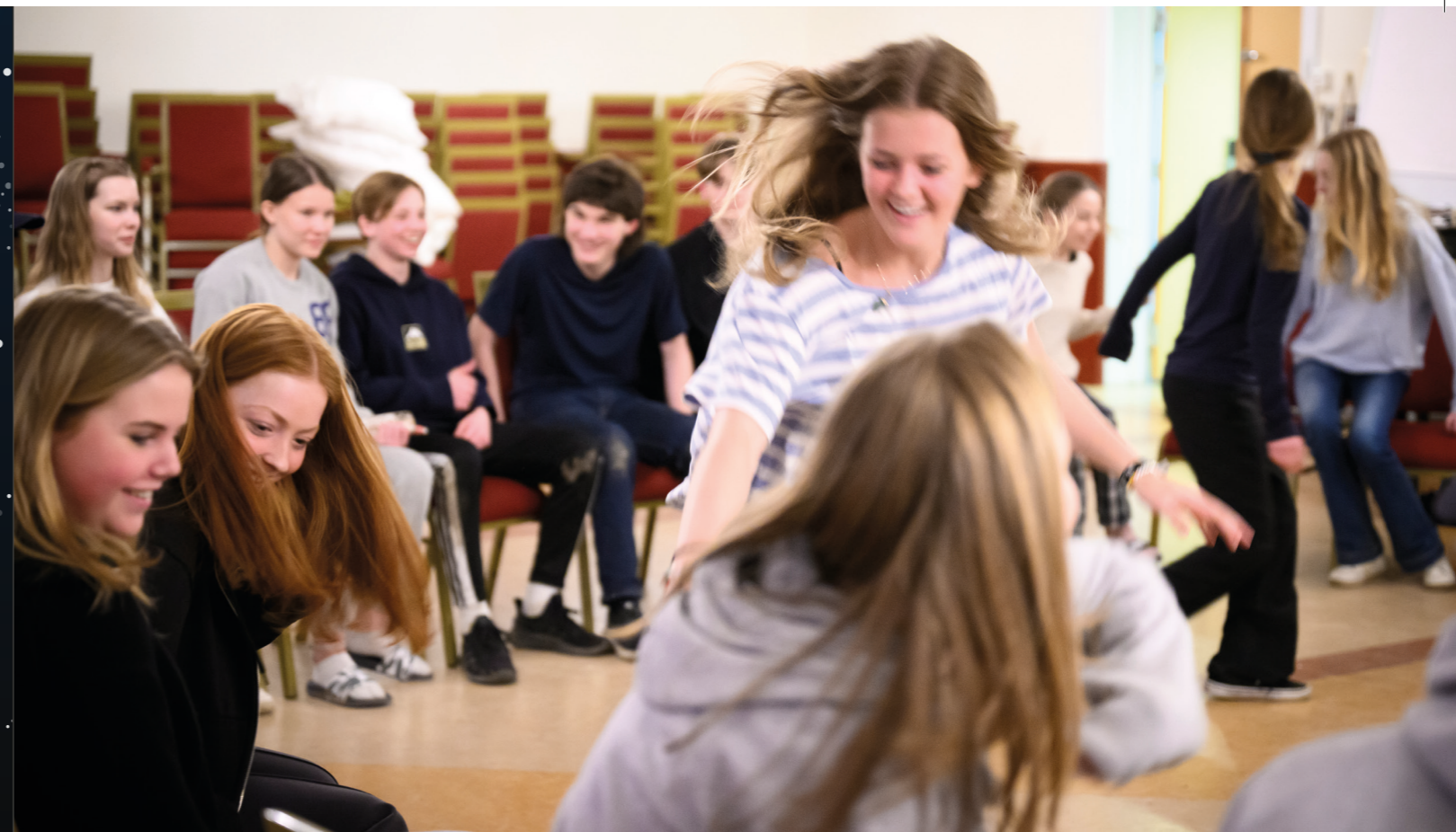
På konfaläger brukar det vara full fart.