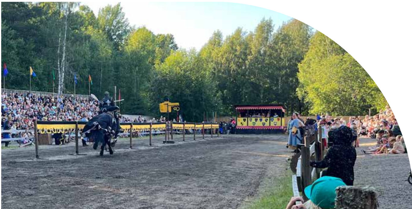
Riddarspel under Hova Riddarvecka.

avvecklats och nyanlända integrerats eller flyttat. Ändå talas fortfarande ca 22 olika modersmål i Gullspångs kommun.