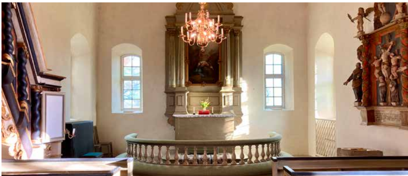
Sveneby kyrka är stängd.

Den grundläggande uppgiften utförs pastoratsövergripande. All personal tjänstgör inom hela pastoratet. Kyrkorådet och kyrkoherden har det övergripande ansvaret för att den grundläggande uppgiften utförs. Församlingsråden fullgör sin uppgift enligt kyrkoordningen.