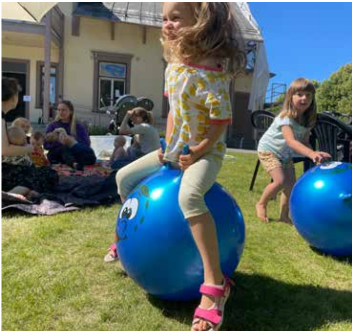
Öppna förskolans har varit uppskattad av både stora och små.

SOMMARVERKSAMHETERNA har pågått för fullt. I juni kom det varje dag flera barn och unga som deltog i Sommar på torgets aktiviteter i Kista. Öppna förskolan har haft sin verksamhet igång i Spånga prästgård där barn och deras vuxna har kunnat vara med på sångstund och leka. I prästgården har det också pågått morgongymnastik, varit andakter och flera besökare har njutit av att sitta ner och fika en stund.