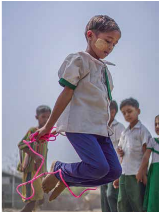
En elev i förskolan hoppar hopprep på gården vid Temporary Learning Spacing (TLS) i Ohn Taw Gyi South IDP camp, Sittwe Township, Rakhine, Myanmar.

Söndagen den 29 september kl. 12.00–15.00 anordnar vi Fest för Världens barn i Kista kyrka. Världens barn är radiohjälpens insamling för barns rättigheter runt om i världen.