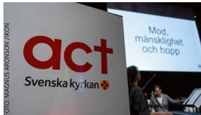
Act står för Action by Churches Together och är ett trosbaserat nätverk med ca 140 medlemsorganisationer som arbetar i mer än 120 länder.

– Ett annat skäl, för att komma tillbaka till det här att vi är kyrka, så handlar det om skapelsens integritet, frågorna om skapelsens värde i sin helhet och människan som del i det. Det engagerar hela den ekumeniska rörelsen. Att lyfta fram den profetiska rösten kring människans värde och ansvaret för framtiden. På så vis kommer frågan både inifrån kyrkan som en del av vår tro och som den levda verkligheten vi ser och lever.