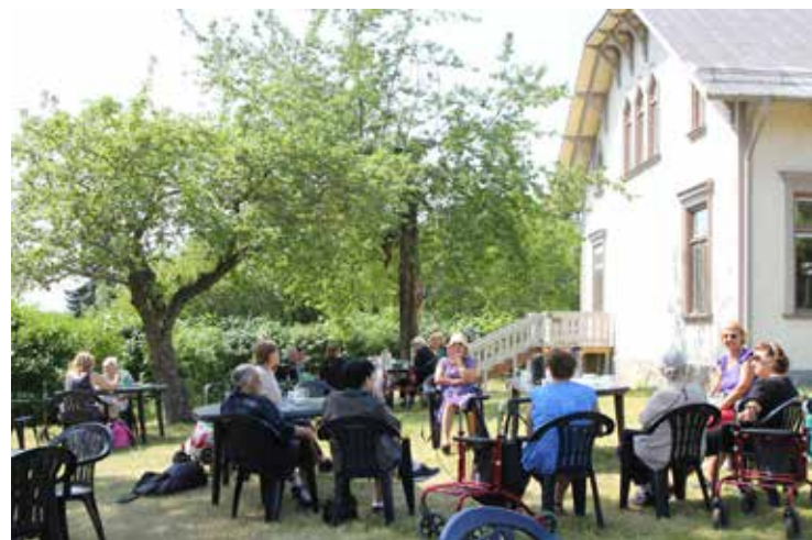
Sommarjobbarna i Spånga prästgård har serverat hemmagjorda våfflor och kaffe.