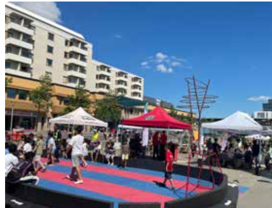
På torget i Kista har ungdomar provat olika sporter och kunnat äta hamburgare till lunch.