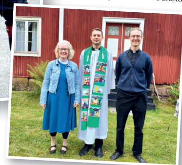
Gemensam gudstjänst vid Järnblåsten, Ilsbo tillsammans med Forsa-Hög och Bergsjö församling. Här är prästerna från de tre församlingarna.