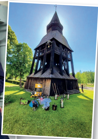
Tjärning av Bjuråkers klockstapel