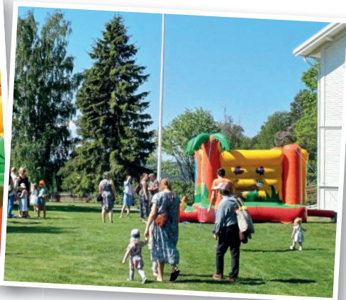
Vårfest för våra barngrupper