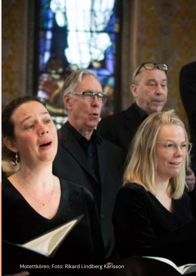
Motettkören