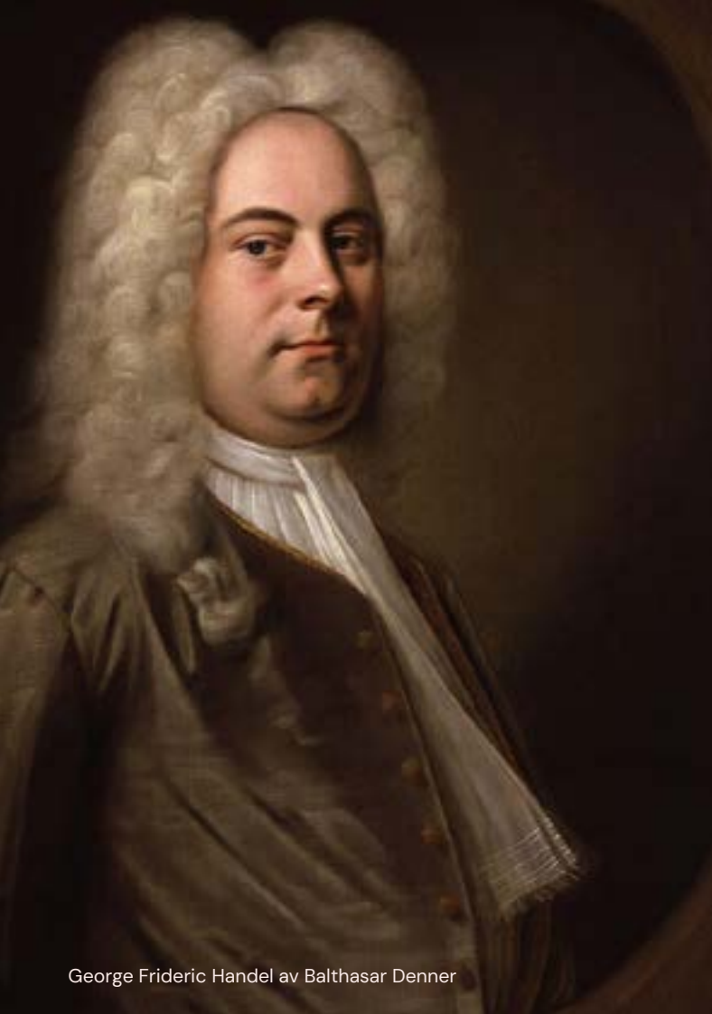
George Frideric Handel av Balthasar Denner