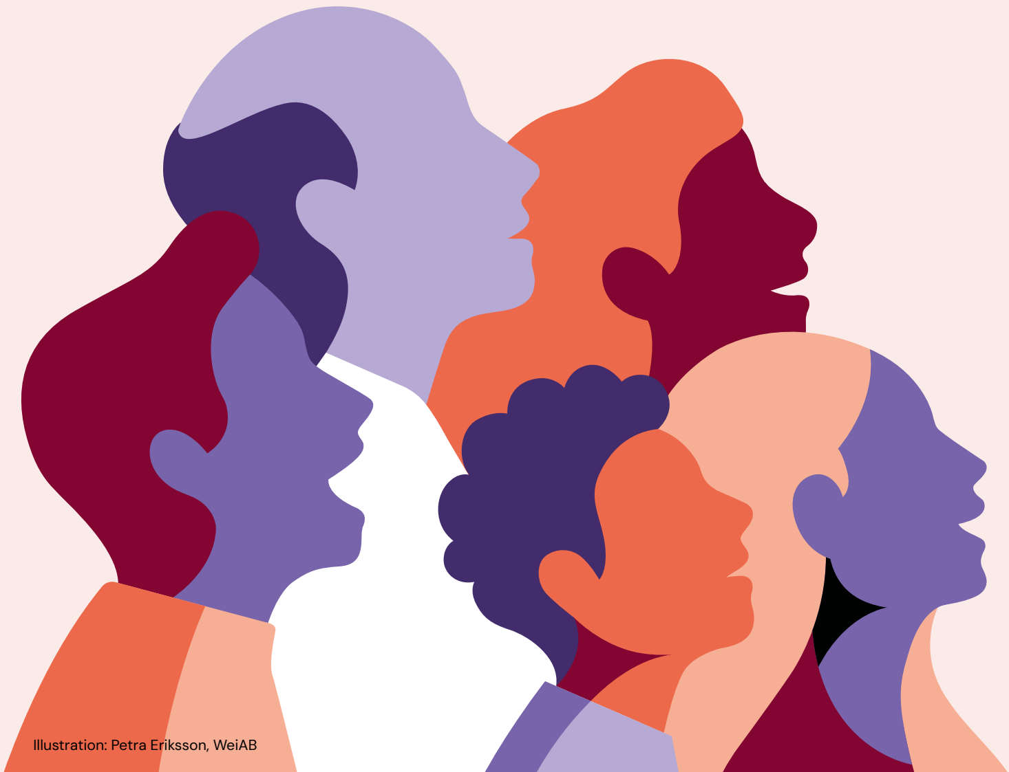
Illustration: Petra Eriksson, WeiAB