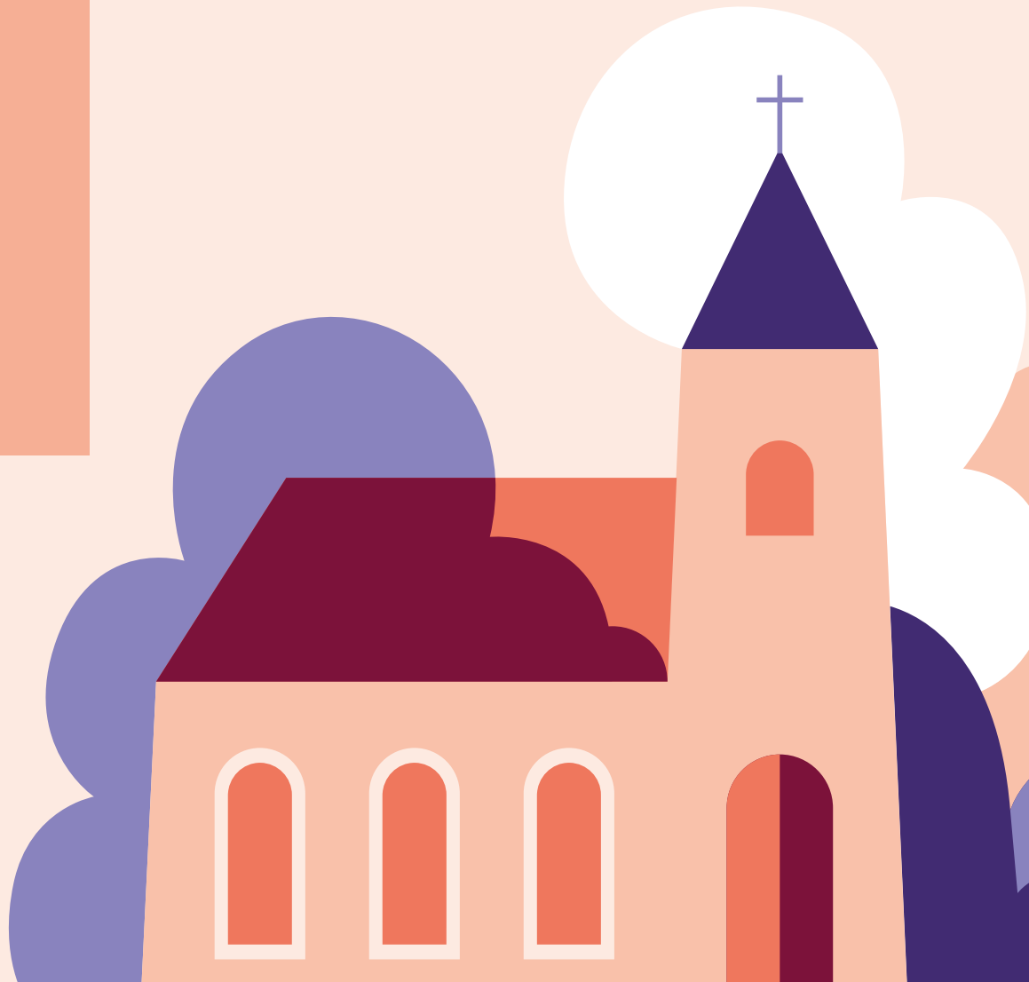
Illustration: Petra Eriksson, WeiAB

Varje onsdagar är det musik och andakt kl 12.15 i Sundbybergs kyrka. Efter musikstunden bjuds du in till en kostnadsfri lunch i församlingssalen.