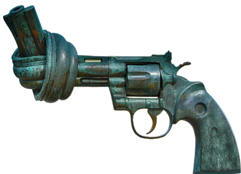
Skulpturen Revolver med knut.

kropp, klimatet samt rättigheter och lika-behandling för exempelvis kulturella eller etniska minoriteter.