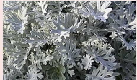
Silverek 22 kr/st

Tålig och lättskött, lång säker blomning.