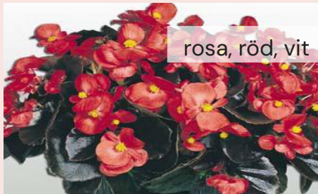
Begonia Cocktail 25 kr/st

Tålig, rikblommande med dekorativa färgade blad.