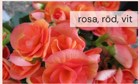
Begonia Non Stop 47 kr/st

Tålig, frodig och hög. Känslig för vind.