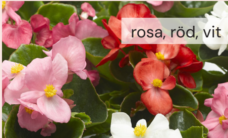
Begonia Semp. 22 kr/st

Tålig och lättskött, lång säker blomning.