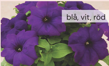
Petunia 22 kr/st