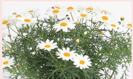
Margurit 44 kr/st

Prästkragelik med silverfärgade blad. Känslig för uttorkning.