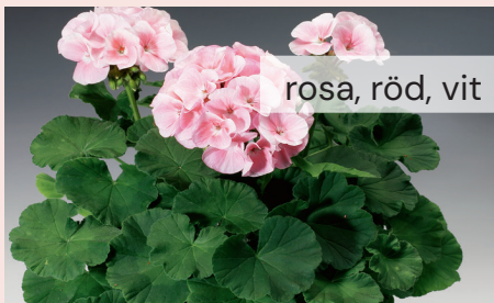
Pelargon 47 kr/st

Värmeälskande, tycker ej om regn. Soligt läge. Hög. Väderkänslig.