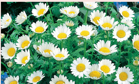
Pysslingkrage 25 kr/st