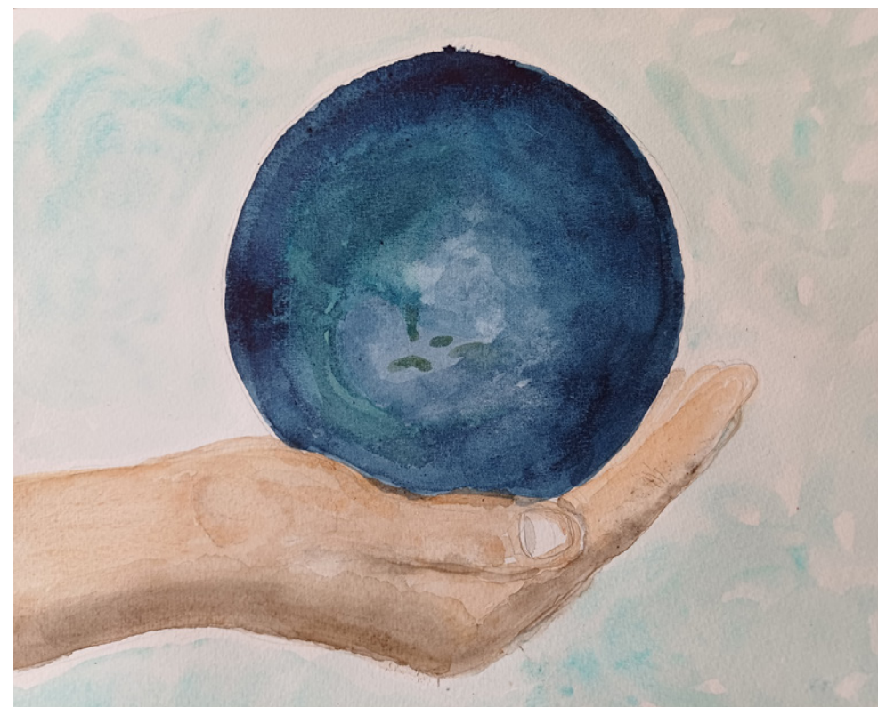
Målning av Agneta Furberg.