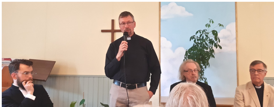
Bild från firandet av Upphärads kyrka 300 år.