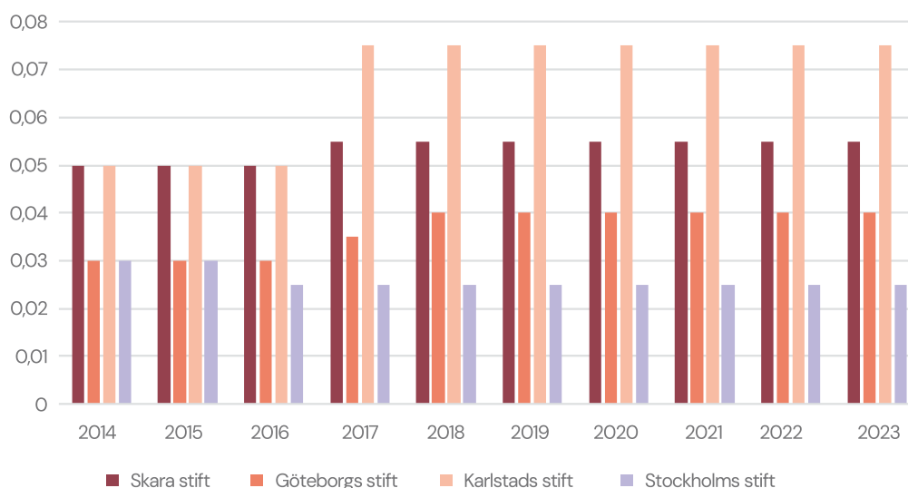
Figur 3. Stiftsavgiftsnivå per år 2014–2023

Som framgår av figur 3 skedde merparten av förändringarna mellan åren 2016 och 2017. Skara och Karlstad stift genomförde en höjning som skulle bestå medan Göteborgs stift gradvis ökade avgiften först från 2016 till 2017 och sedan igen till 2018. Stockholms stift är det enda stiftet som i stället sänkt avgiften, från 2015 till 2016. Avgiften till Samhälligheten Gotlands kyrkor har sedan 2000-talet legat på 0,15 procent. Variationen i hur mycket en medlem betalar i kyrkoavgift beror främst på förändringar i den procentsats som sätts på pastoratsnivå. Där har det skett betydligt fler förändringar i jämförelse med stiftsnivån. I genomsnitt har den procentsatsen legat strax över 1 procent och stadigt ökat sedan början på 2000-talet, se figur 4.