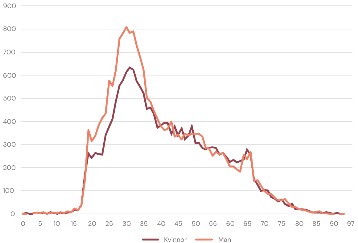
Figur 2. Antal utträden per ålder och kön 2023