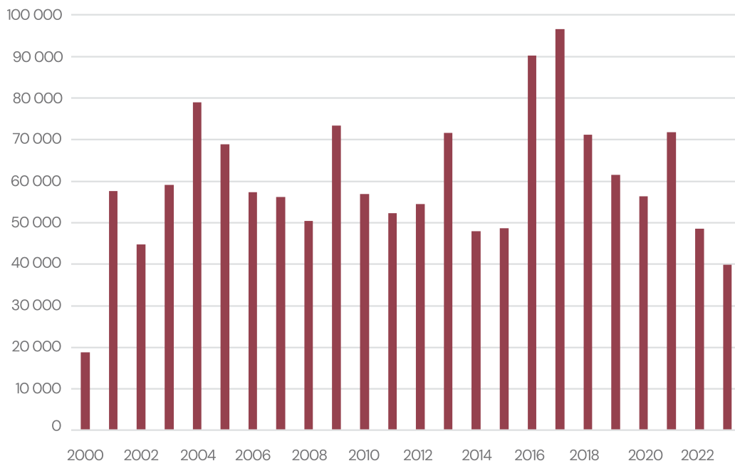
Figur 1. Antal utträden per år 2000–2023

Från och med den 1 januari 1996 blir nyfödda personer i Sverige inte längre automatiskt medlemmar i Svenska kyrkan som en följd av att minst en av föräldrarna är medlem. I stället blir medlemskapet något som föregås av ett aktivt val, vanligtvis genom dop, antingen som eget eller vårdnadshavares val. Hur många medlemmar som i sin tur väljer att lämna Svenska kyrkan har sedan 2000-talet varierat något, men har ändå för de flesta år legat på mellan 40 och 60 tusen, se figur 1.