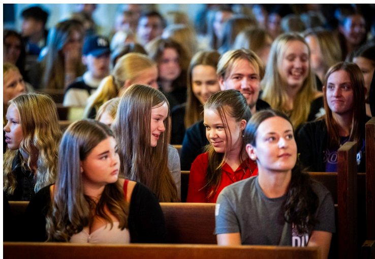
Även ungdomar behöver kunna hålla styrelsemöten och årsmöten.