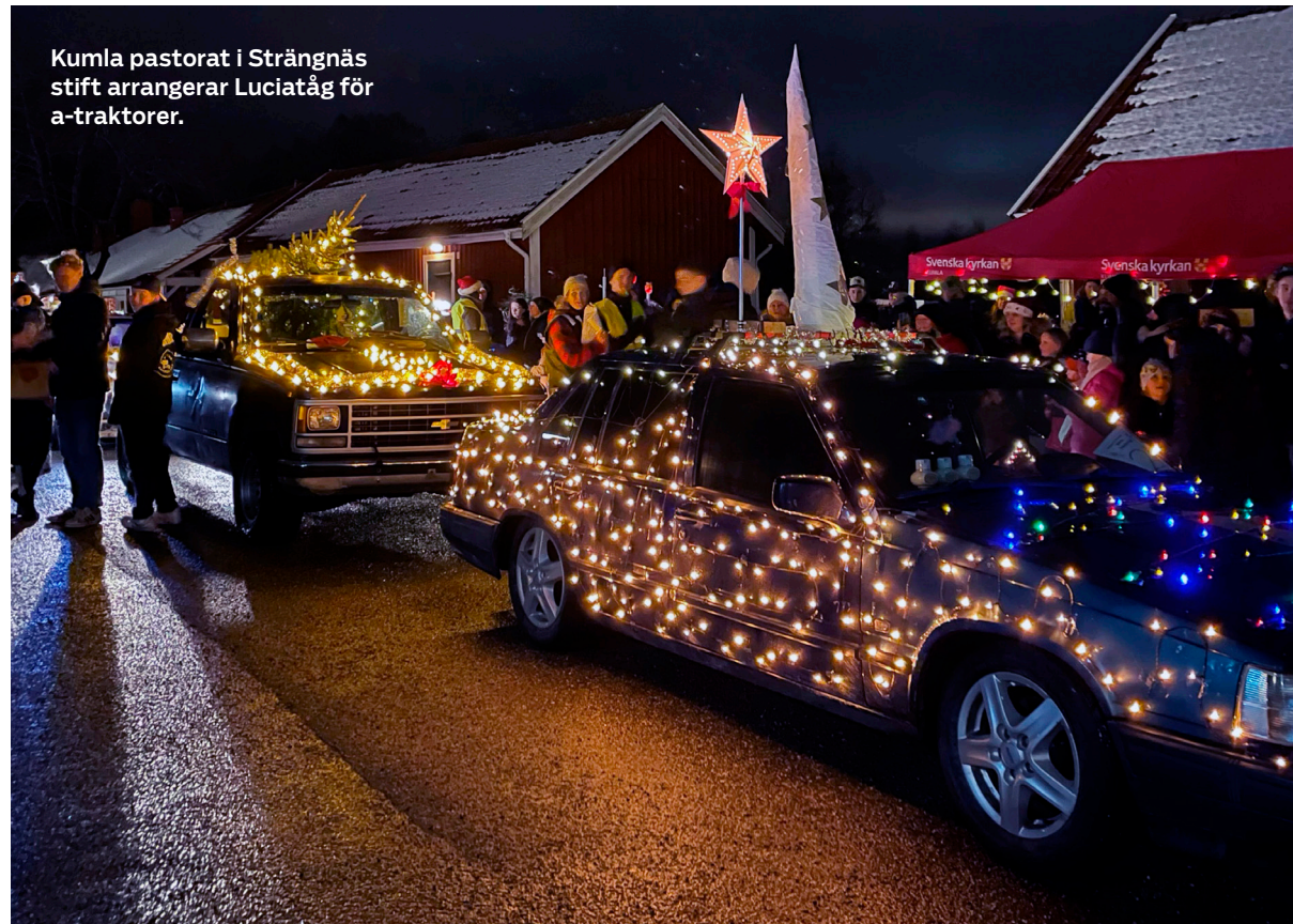
Kumla pastorat i Strängnäs stift arrangerar Luciatåg för a-traktorer.