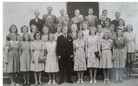
Illustration 80 skylt: Karin Dahlström

/Sofia Fälth, kyrkomusiker Vårdnäs församling