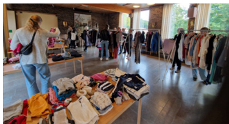
Mycket att välja på under lördagens klädbasar.

Torsdagskvällen avslutades med Meditation i Skallsjö kyrka.