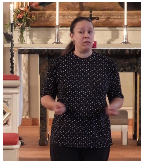
Maria Wetterstrand pratade i Skallsjö kyrka.

Senare under lördag kväll så besöktes Skallsjö kyrka av Maria Wetterstrand, före detta ledamot i Sveriges Riksdag, som pratade om vikten av att alla måste göra något. Hur litet det än kan verka så ger det ringar på vattnet.