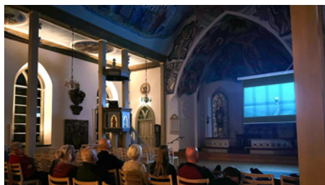
Filmvisning i kyrkan med dokumentären "From the Wild sea".

De fällda träden tas tillvara. Antingen genom att bli flis, eller att de läggs i en deponi, en hög med träd och grenar, så att insekter och fåglar har någonstans att vara.