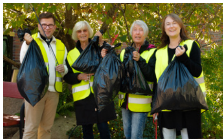
Flera säckar med skräp blev resultatet av torsdagens plogging med promenadgruppen.

På onsdagskvällen gjordes en Pilgrimsvandring med besökare och konfirmander från församlingshemmet till kyrkan där man såg på dokumentärfilmen "From the Wild Sea". Filmen handlar om havets fantastiska liv samt de krafter som nu hotar.