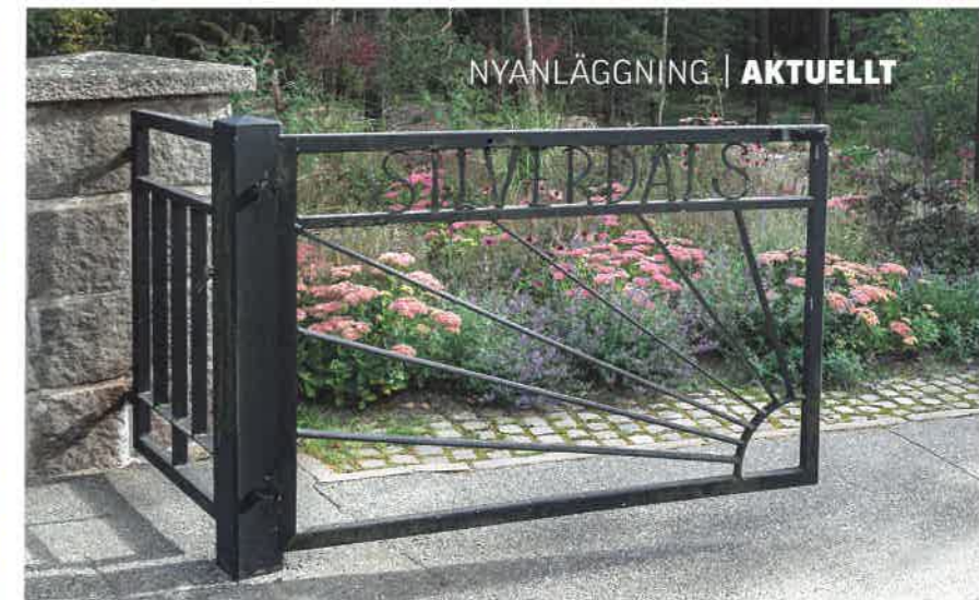
En av de befintliga fjärrsrestaurangerna vid Silverdals griftegård. De får nu sällskap av blommande ängsväxter.