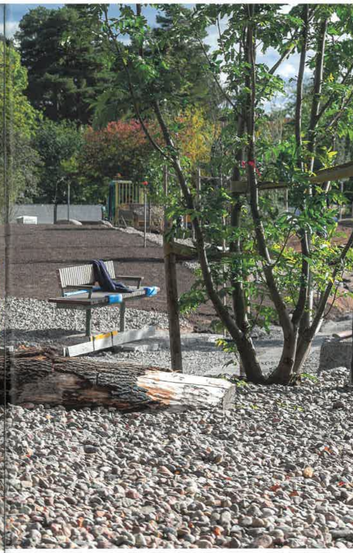
de täcks med gräs ser man de långa betongplintarna för gravvärdar.