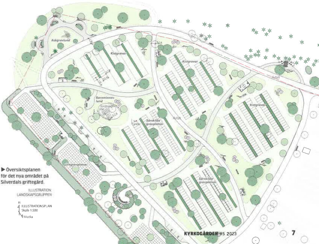
Översiktsplanen för det nya området på Silverdals griftegård. ILLUSTRATION: LANDSKAPSGRUPPEN

Griftegården vid Silverdal har vuxit bit för bit genom årtiondena, och fick