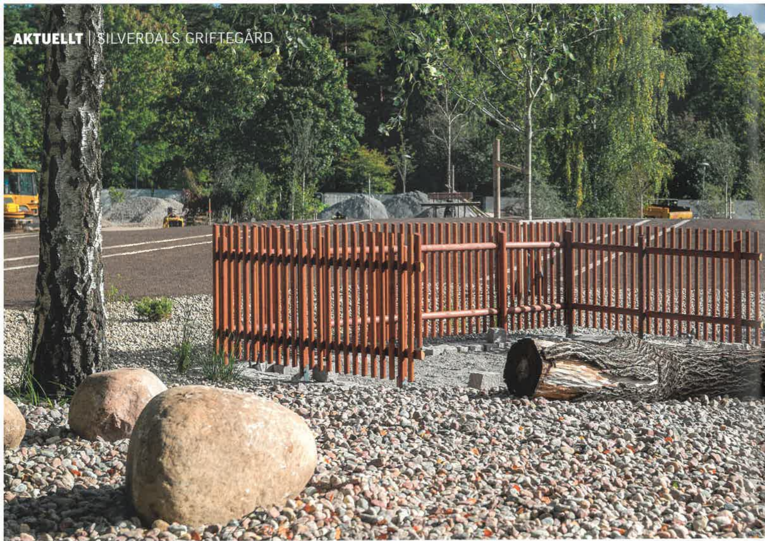
Död ved, sand- och grusgrunden för ängsväxterna samt dekorativa stenar. Det är lite av grundelementen på Silverdals nyanlagda del. I bakgrunden anas de plana ytorna för kistgravar och särskilda gravplatser. Innan