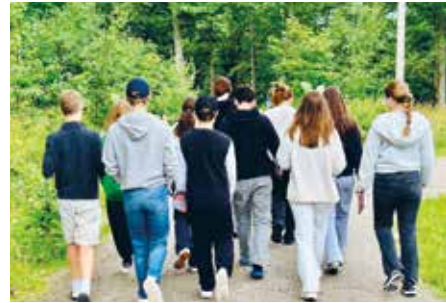
Höstterminens ungdomsverksamhet har dragit igång med full kraft. I år har församlingen 9 konfirmander och 11 unga ledare i olika åldrar.