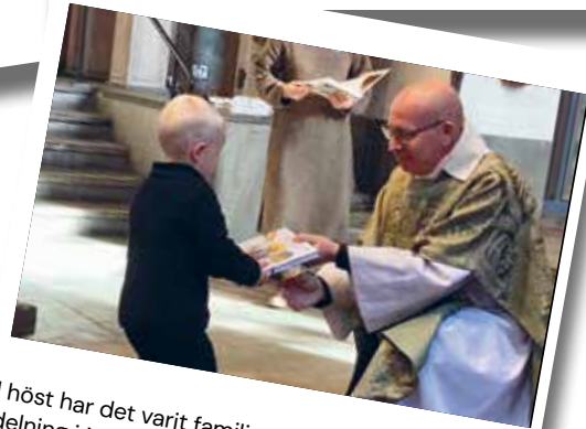
I höst har det varit familjemässa med bibelutdelning i Margaretkyrkan! Barnkörerna bjöd på sång, barnen upptäckte kyrkan och det bjöds på fest.