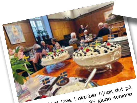
Ett fyrfaldigt leve. I oktober bjöds det på kalas i kyrkan och hela 35 glada seniorer blev firade stort. Hipp Hipp hurra!