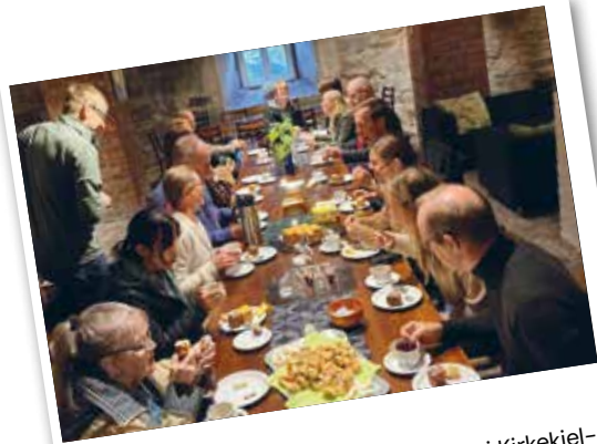
Tänk så kul. I september var det fullt i Kirkekjelleren efter gudstjänsten i Trondheim. Dagen bjöd på sång och musikgudstjänst!