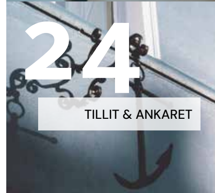
TILLIT & ANKARET