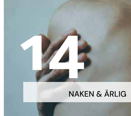
NAKEN & ÄRLIG