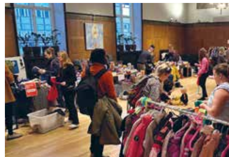
I oktober var det dags för terminens Barnloppis och kyrkan fylldes med barn och vuxna i alla åldrar. Över 6400 kr samlades in till Sykehusklovnene.