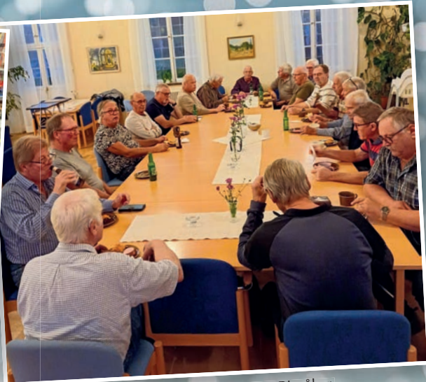
Här träffas Gubbz i församlingsgården i Bjuråker. Det bjuds på alkoholfri öl och korv.