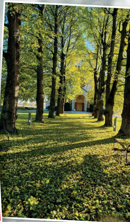
Delsbo kyrk allé i h