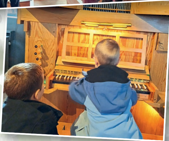
6-års från Friggessund och Svågadalen gjorde ett studiebesök i kyrkan.