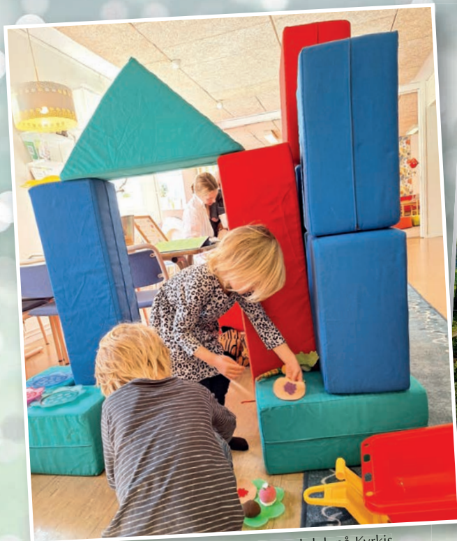
Bus och lek på Kyrkis