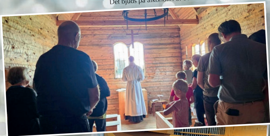
Mässa i Stråsjö kapell