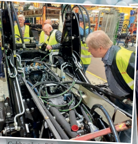
Gubbz på studiebesök hos Huddig