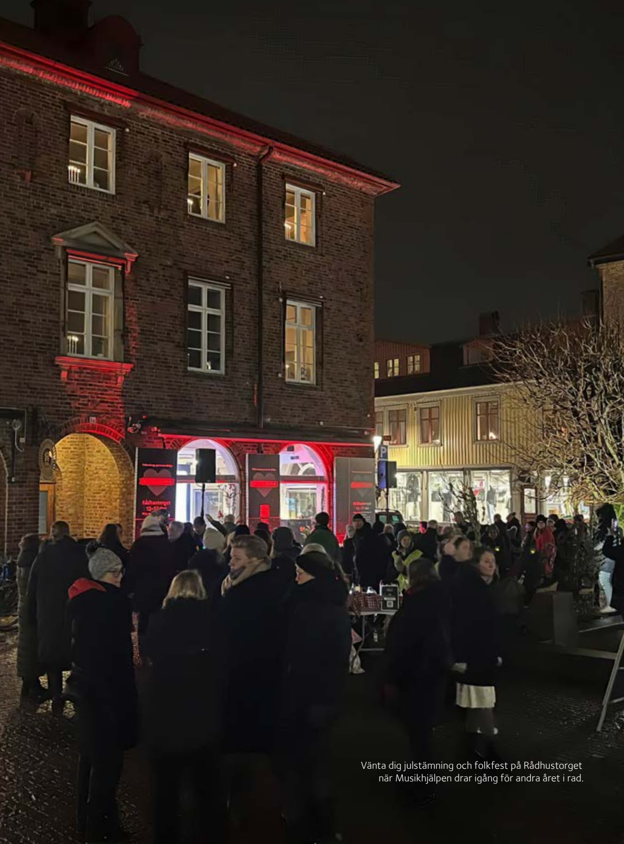
Vänta dig julstämning och folkfest på Rådhusorget när Musikhjälpen drar igång för andra året i rad.