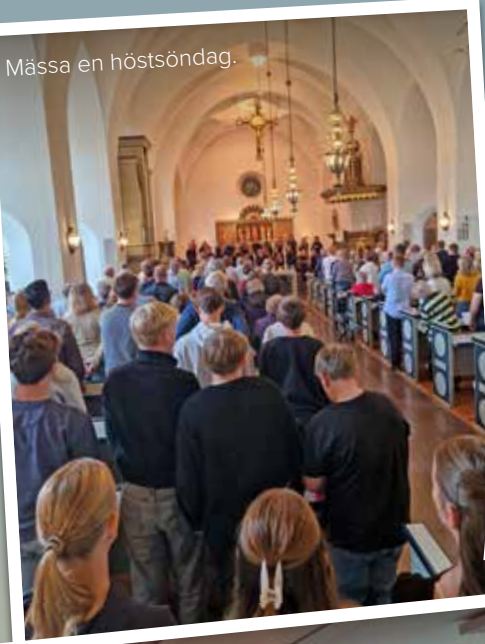
Mässa en höstsöndag.