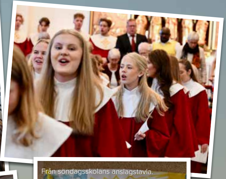
Från söndagsskolans anslagstavla.