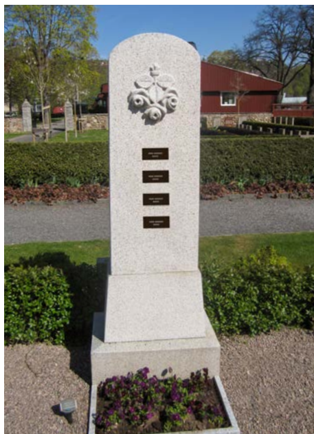
1 02 A 6