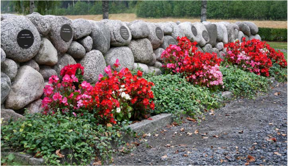
3 GA L 39