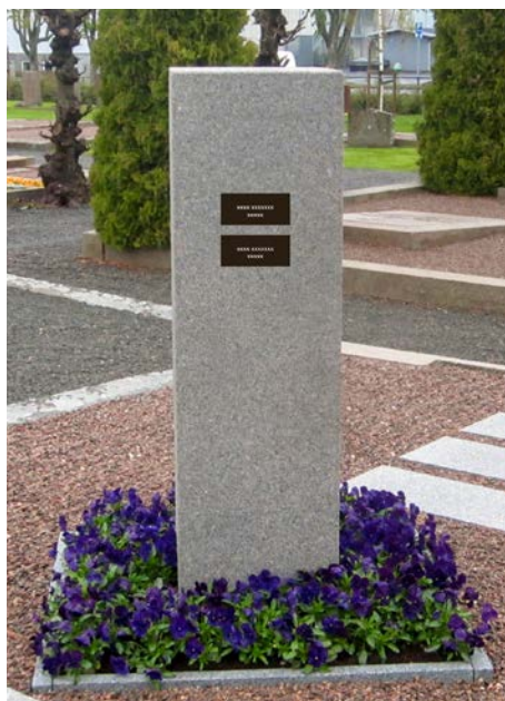
1 13 B3-4