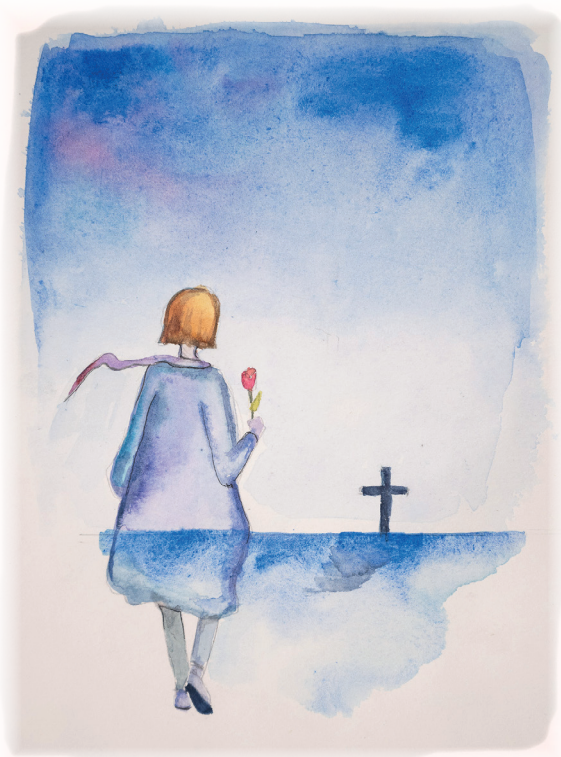
KUVITUS: ULRICA ROBSARVE, 2024 TEKSTI: LENA BERGMAN, 2024