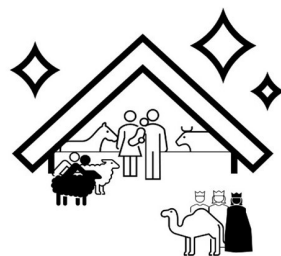
Egen illustration med ikoner från M365

Matteus berättar att några österländska "stjärntydare" (grek μάγοι, lite oklart vad ordet egentligen avser) kommer för att vörda den nyfödde kungen. De har med sig tre gåvor, varför man också har tänkt sig att de är just tre stycken. Senare traditioner avbildar dem som kungar och ger dem också namn: Kaspar, Melchior och Baltasar. De tre vise människors besök firas på trettondedagen, 6 januari, varför en korrekt julkrubba avbildar dem på väg till Jesusbarnet, för att sedan flyttas in i stallet på trettondedagen.