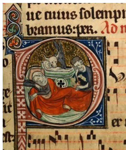
Jesu födelse avbildad i ett engelskt missale från ca 1310-1320

Herdarna, vars arbete var slitsamt och dåligt betalt, får symbolisera de många fattiga och utsatta, som trots (eller tack vare) att de finns långt från maktens korridorer, är de första som får ta emot budskapet om den nyfödde frälsaren.