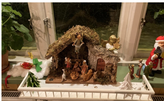
Vår julkrubba hemma. Notera hur de tre vise männen fortfarande är på väg till stallet.

Skicka in en bild på din krubba senast 15 december till rommele.forsamling@svenskakyrkan.se , så hoppas vi kunna ställa ut era foton i kyrkorna. (på Julafton i Upphärad, Nyårsdagen i Rommele och Trettondedagen i Fors)