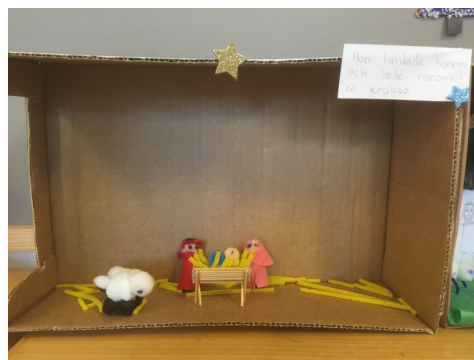
Julkrubba från konfirmand-pysel.

Vi vill gärna se hur just din krubba ser ut! Kanske har du köpt en speciell på en semester i Europa, eller fått en vacker i julklapp något år? Eller bygger du din egen i kartong, eller är rentav årets pepparkakshus en pepparkakskrubba?