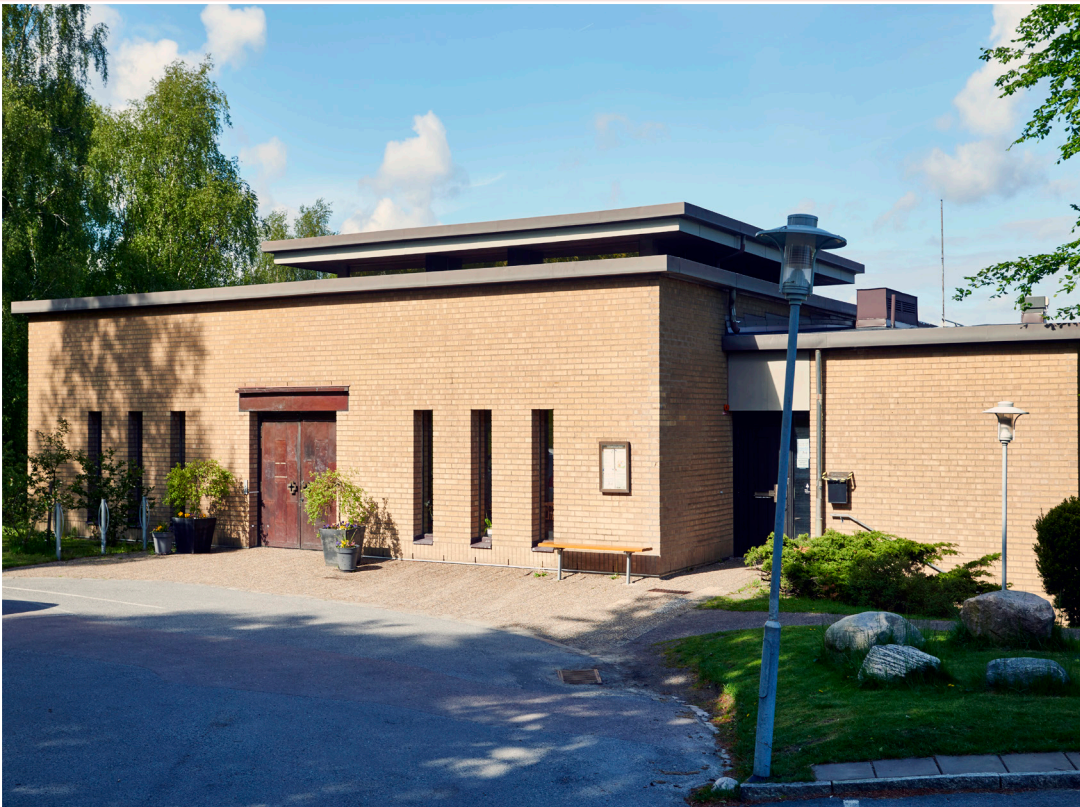
Mikaelskyrkan Askims Backaväg 5 Askim