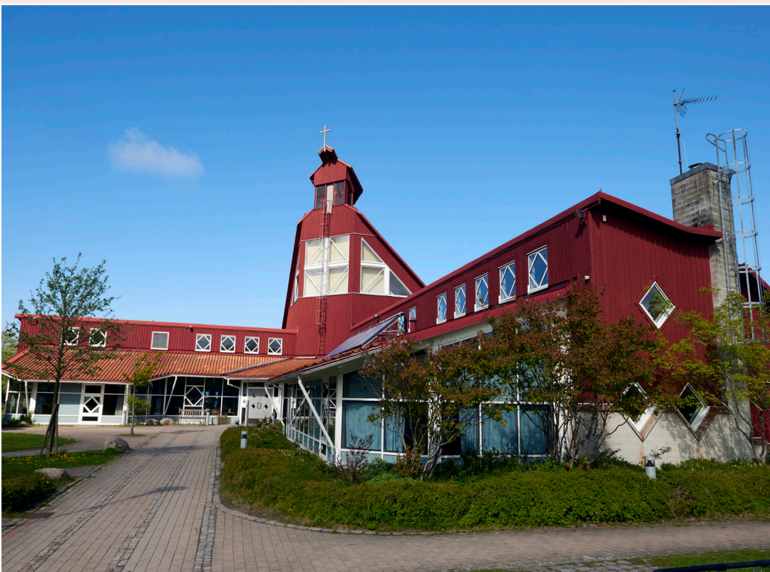
Billdals kyrka Billdals Kyrkväg 1 Billdal

Askims församling Skalldalsvägen 1B, 436 52 Hovås Telefon: 031-731 63 10 E-post: askim.forsamling@svenskakyrkan.se Hemsida: www.svenskakyrkan.se/askim