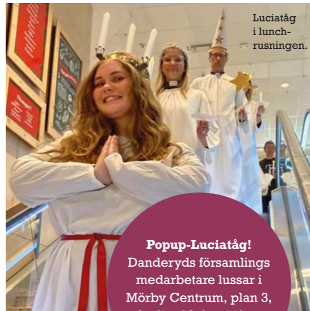
Luciatåg i lunch- rusningen.