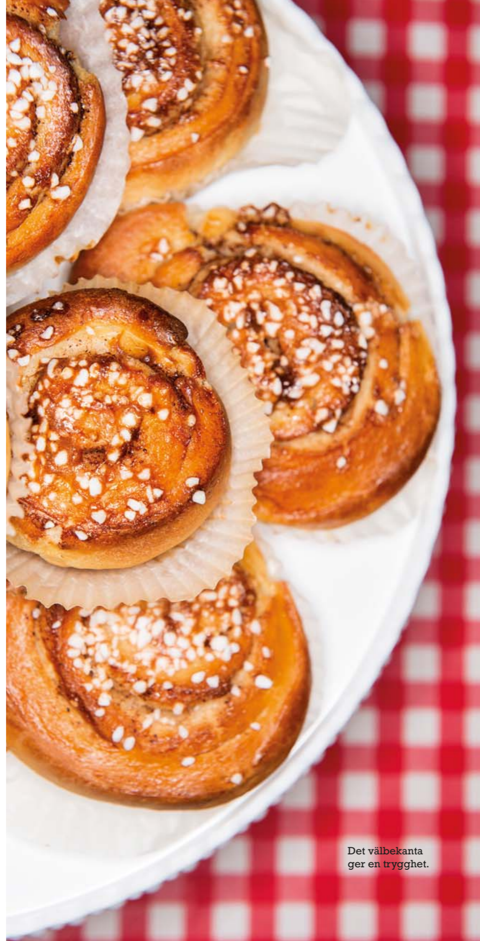
Det välbekanta ger en trygghet.

– Jag brukar säga att det handlar om att se på vad vi faktiskt kan påverka: Att leva ett så fredligt liv som möjligt, men också att ta vara på ljusglimtarna som finns där. Att samla på hopp, helt enkelt. ♦