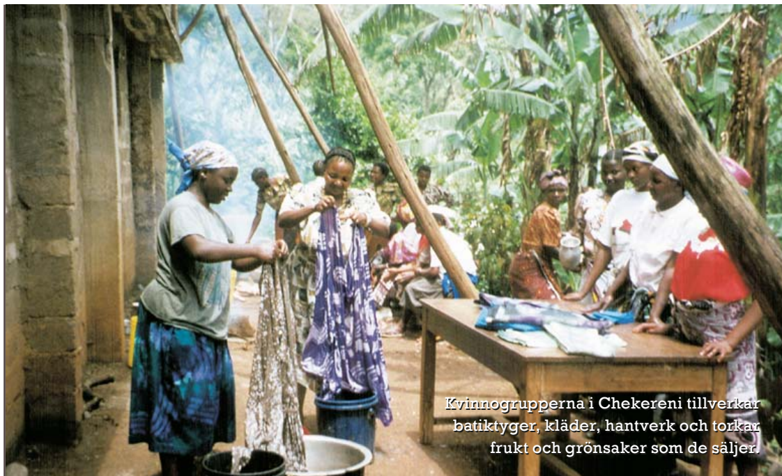
Kvinnogrupperna i Chekereni tillverkar batiktyger, kläder, hantverk och torkar frukt och grönsaker som de säljer.