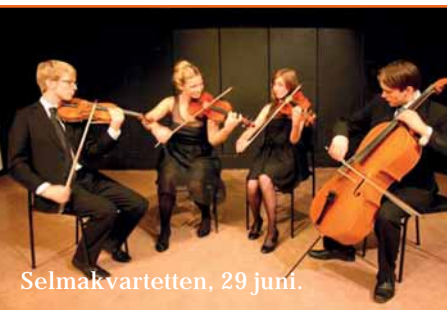
Selmakvartetten, 29 juni.