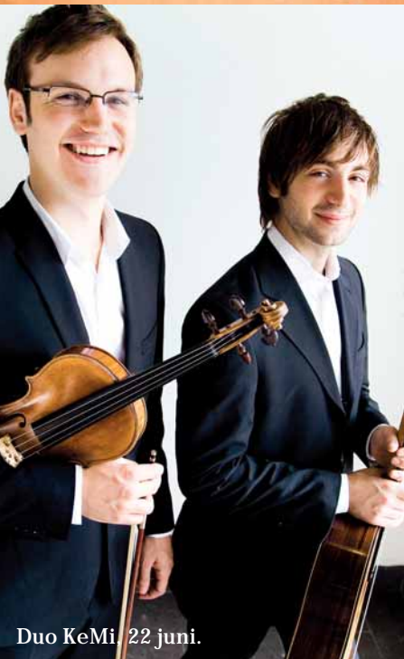
Duo KeMi, 22 juni.