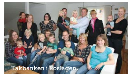
Kakbanken i Roslagen.