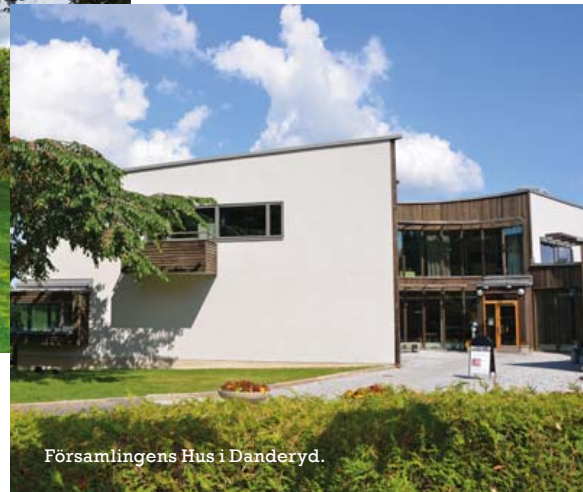
Församlingens Hus i Danderyd.

Avfärd: 9.30 Eneby torg, 9.45 Danderyds kyrkas parkering samt 10.00 Myrans Livs, Mörby. Åter i Danderyd: 1 augusti 18.30, 8 augusti 17.15 och 15 augusti 16.00.