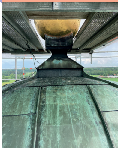
Det gamla koppartaket från 1800-talet och de nya specialböjda kopparplåtarna.

Första onsdagen i månaden start 5/2. Mässa, mat, lek & gemenskap – för alla åldrar. Efter en enkel kvällsmässa 17.30 upp middagsmat och alla som vill stannar och äter tillsammans. Du som har möjlighet betalar en slant för maten. Mikaelsgården.