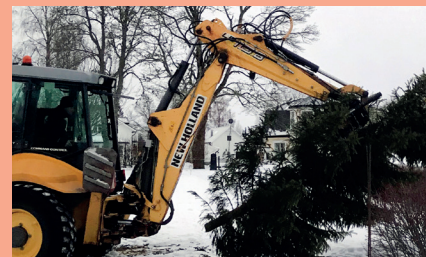
Julslut. De höga granarna forslas bort med hjälp av traktor.