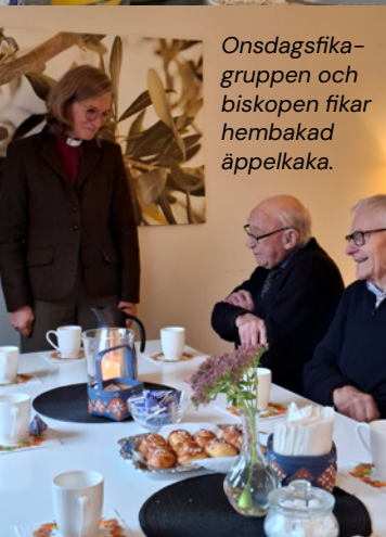
Onsdagsfika-gruppen och biskopen fikar hembakad äppelkaka.