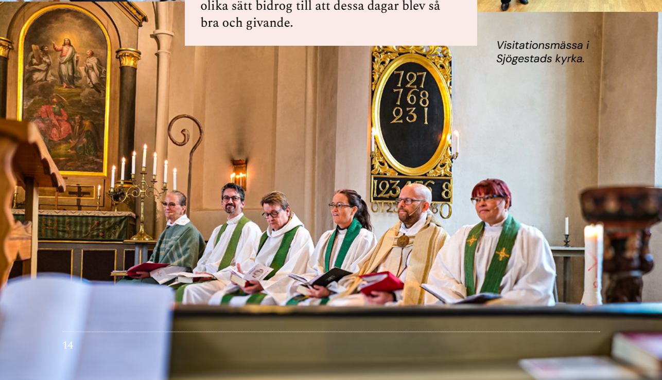
Visitationsmessa i Sjögestads kyrka.