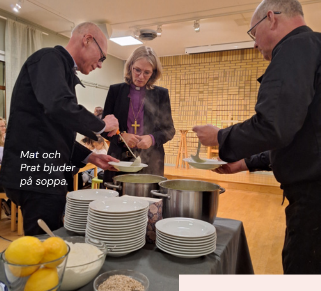
Mat och Prät bjuder på soppa.