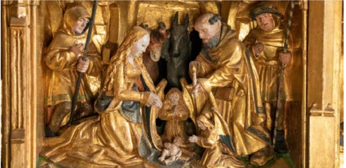
Detaljbild från altarskåpet i Häverö kyrka