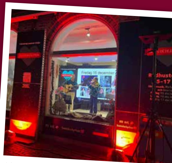
I år kommer närmare 300 medverkande bidra i kyrkans skyltfönster under Musikhjälpen i Falkenberg.

Musikhjälpen: Arrangeras av P3 Sveriges Radio, SVT och Radiohjälpen sedan 2008 för att samla in pengar till människor som kämpar för rätten till ett värdigt liv. Act Svenska kyrkan är en av hjälporganisationerna som fördelar pengarna.