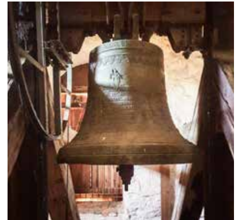
Vid Slöinge kyrkas 200-års jubileum ville många besökare titta på kyrkklockorna.

För att förhindra det gömdes ibland klockorna undan, ofta tillsammans med kyrksilvret. Men det var inte alltid det gick som det var tänkt. Det berättas till exempel att lillklockan i det som då kallades S:t Johannes kyrka i Abild på 1500-talet gömdes undan i närliggande Lillsjön för att inte dras in till kronan. Men av någon anledning försvann klockan i djupet och saknas