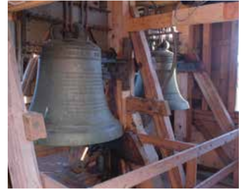
Vissa kyrkor har en klocka, men i Svartrå klingar en stor och en liten tillsammans.

Det var dock inte alla som såg något annat värde i kyrkklockorna än den metall de var tillverkade av. Kyrkklockor har alltid varit ett eftertraktat krigsbyte, som stals för att smältas ner och göras om till vapen.