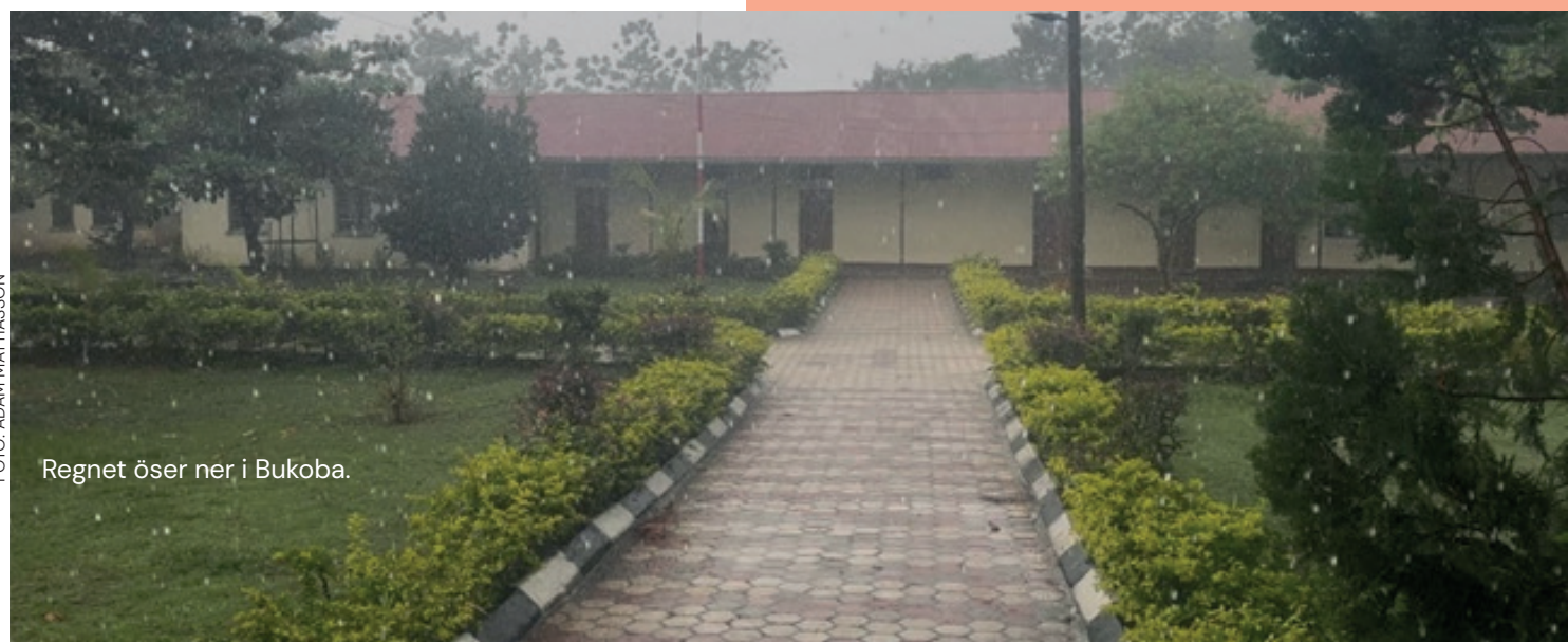
Regnet öser ner i Bukoba.

Kontakta ulrica.hansson@svenskakyrkan.se