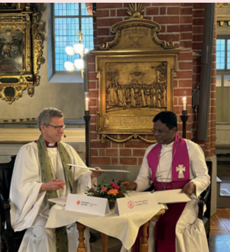
Bilder från signeringen i Domkyrkan den 10 oktober 2024.

Tack för att ni även tar med den tamilska evangeliskt lutherska kyrkan i era böner för Stockholms stifts vänkyrkorelationer.