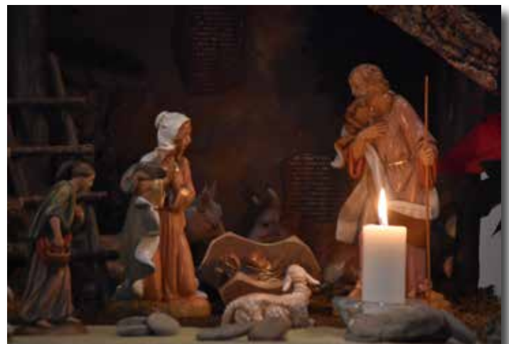
Julkubban i Hälleberga kyrka.