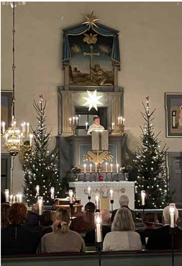
Jul i Kristvalla 2023

Se "Barngrupper/barnkörer/ ungdomsverksamhet" resp. "Vuxenkörer"