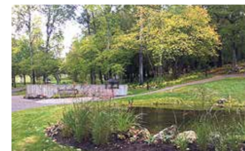
Askgravlund, Görvälns griftegård.