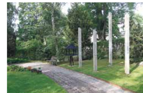
Askgravlund, Järfälla kyrkogård.