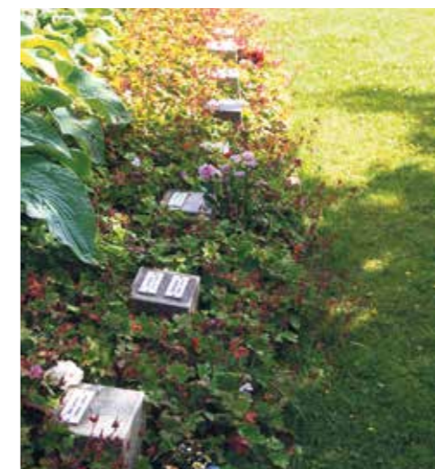
Askgravplats, Järfälla kyrkogård.

MER INFORMATION finns i broschyren Val av grav som finns i våra kyrkor. Du kan också ringa till församlingens kansli på 08-580 218 03.