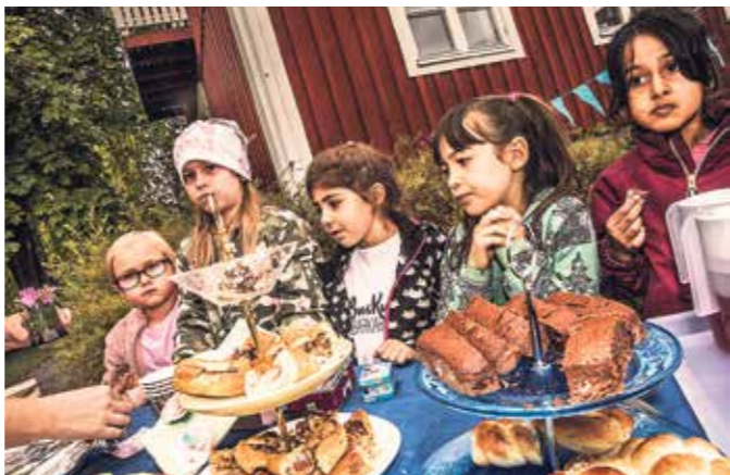
Fannykaka och andra läckra bakverk drog till sig stor uppmärksamhet.