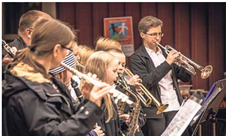
Järfälla kulturskola stod för musikunderhållning på församlingshemmets veranda.