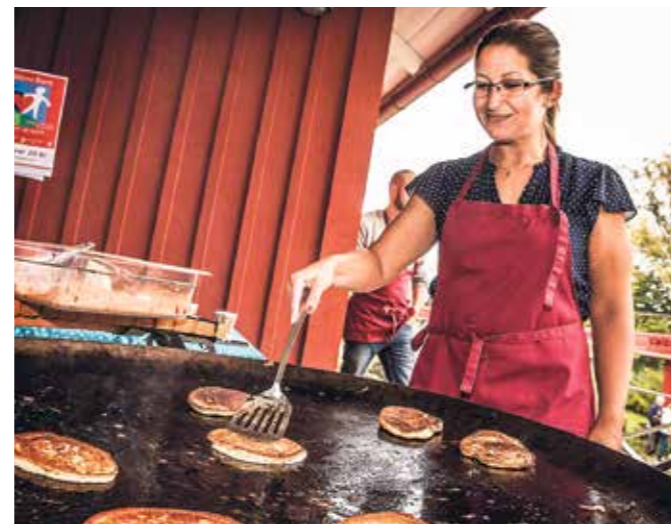
Nygräddade krabbelurer – en korsning mellan sockerkaka och amerikansk pannkaka, doppas i socker – såldes till förmån för Världens barn.