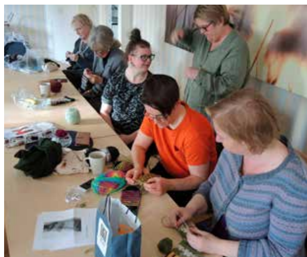
Stickcaféet söndagen den 13 oktober.