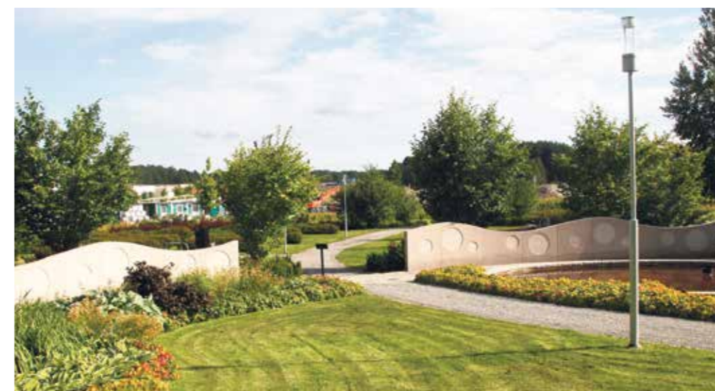
Den andra askgravlund på Järfälla kyrkogård.