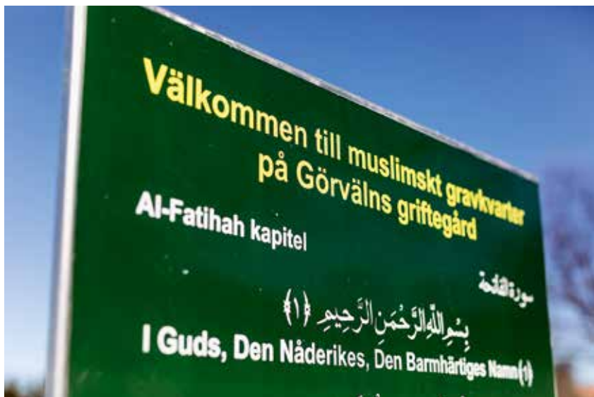
På Görvälns griftegård finns sedan ett par år ett muslimskt gravkvarter.