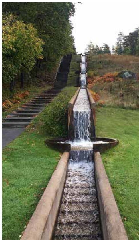
Från minneslunden på Görvälns griftegård löper en vattenrappa ner till en damm.