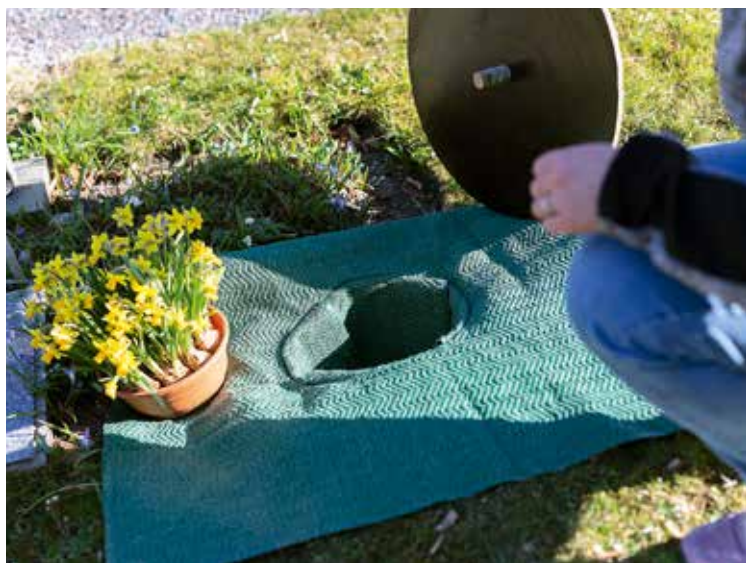
Förberett för urngravsättning på Järfälla kyrkogård.