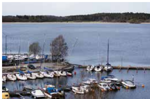
Utsikt över Mälaren från vandringsstigen bakom Sankt Lukas kyrka.

– Det största universum vi har kanske inte är ute i rymden utan inåt, i oss själva.