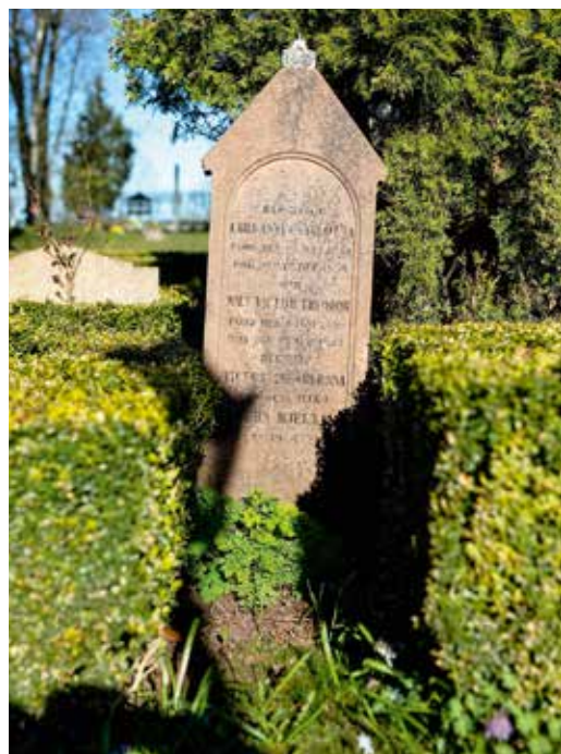
Familjen Ankarcronas gravsten från 1800-talet. En av de äldsta gravstenarna på Järfälla kyrkogård.

Enligt begravningslagen måste kremering eller gravsättning av kista ske inom 30 dagar efter dödsfallet. Efter kremering måste gravsättning av askan ske inom ett år.