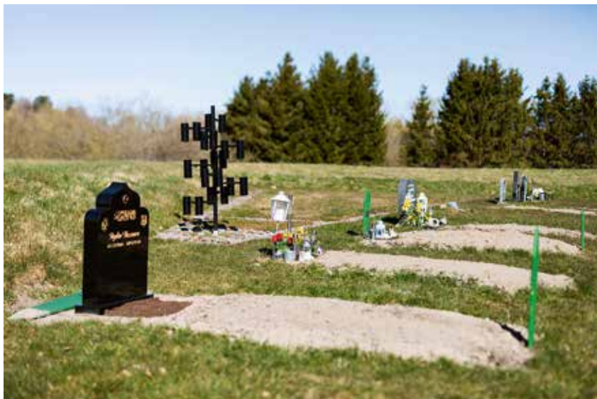
Natursköna omgivningar vid Görvälns griftegård.