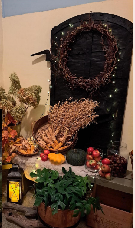
Tacksägelsedagen i Frösve kyrka