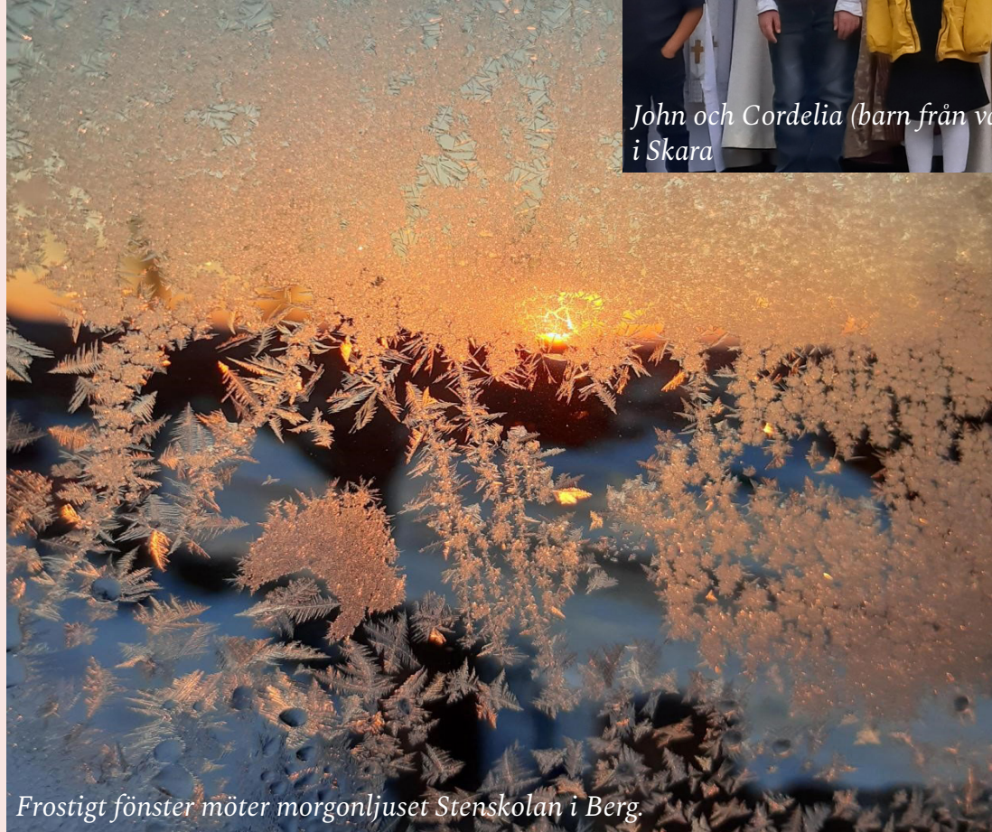
Frostigt fönster möter morgonljuset Stenskolan i Berg.