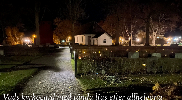
Vads kyrkogård med tända ljus efter allhelgona