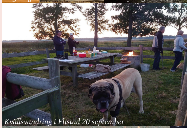
Kvällsvandring i Flistad 20 september