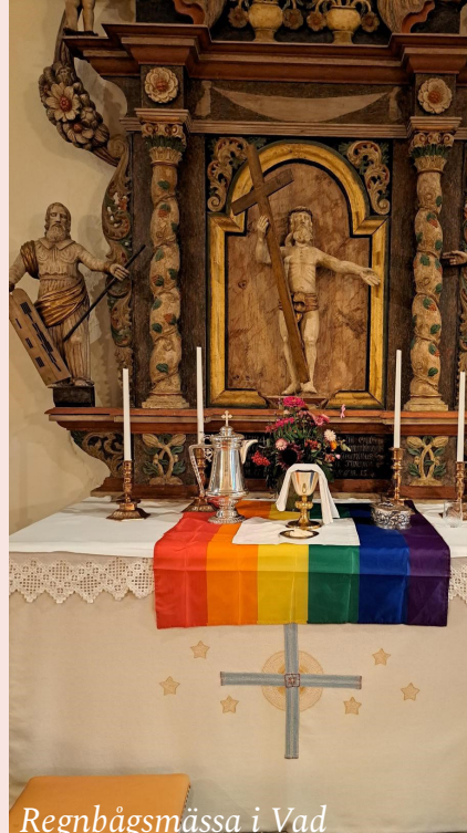
Regnbågsmässa i Vad