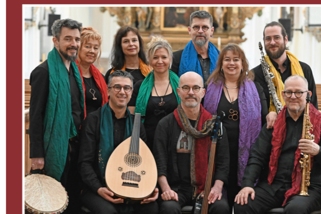
Sångensemblen Amanda och Vibafemba samt Trio Samara.

Gå gärna in och läs mer och se filmer från Svenska kyrkans skogsutredning: https://www.svenskakyrkan.se/skogsutredning