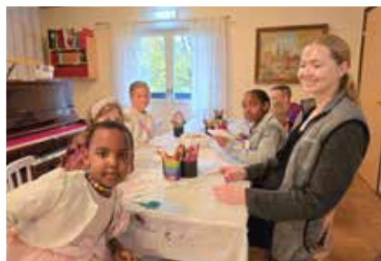
Familjegudstjänst och SKUT fest i Mölltorps kyrka och församlingshem.