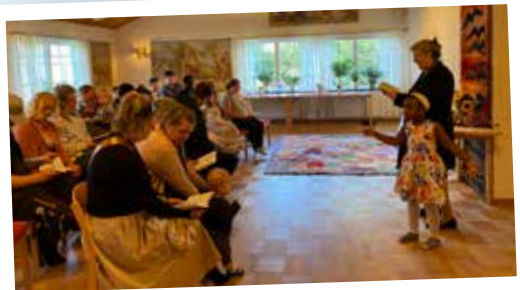
Dopdagsfest och Barnens öppna kyrka i Mölltorps församlingshem.