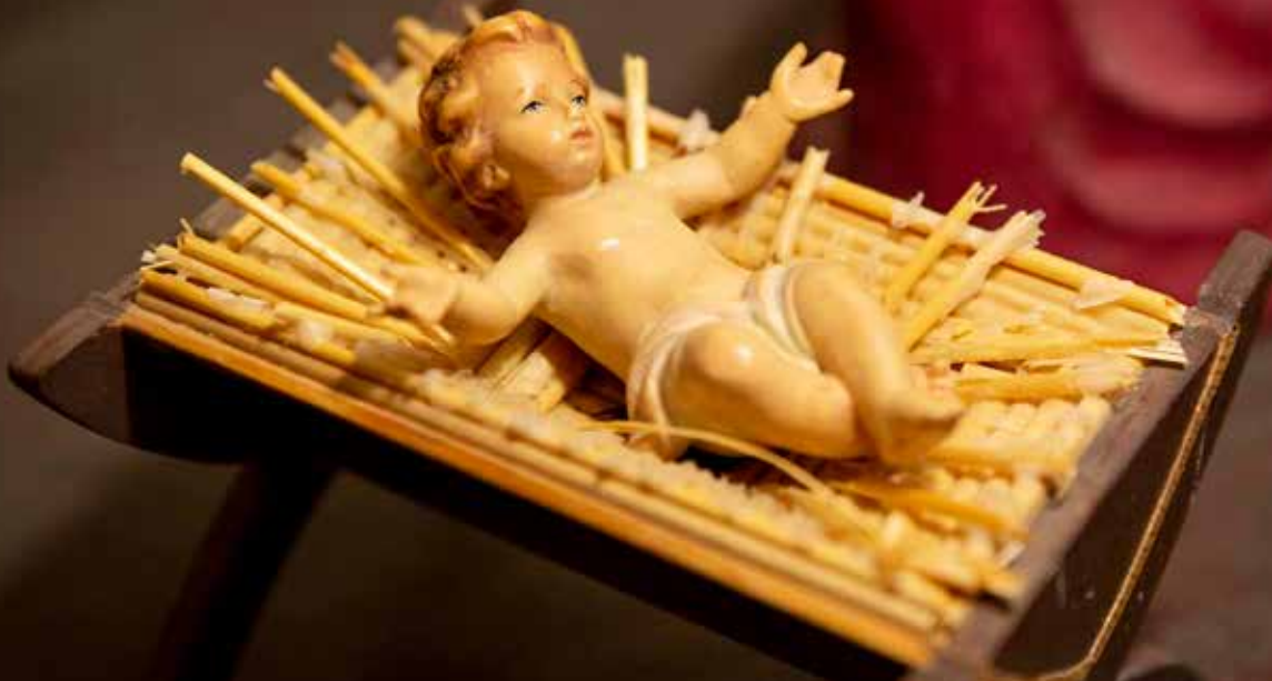
Jesusbarnet ligger i en krubba.