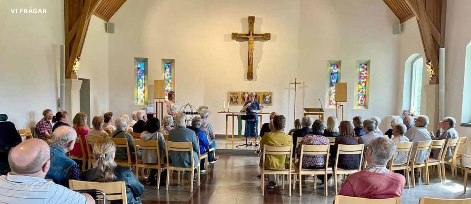
Teckenspråkig gudstjänst i kyrksalen på Flämslätts stiftsgård.