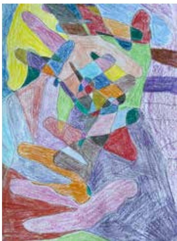
Rita av din hand flera gånger på samma papper. Måla i olika färger.

Här på bilderna finns några exempel på hur du kan göra. Lycka till!