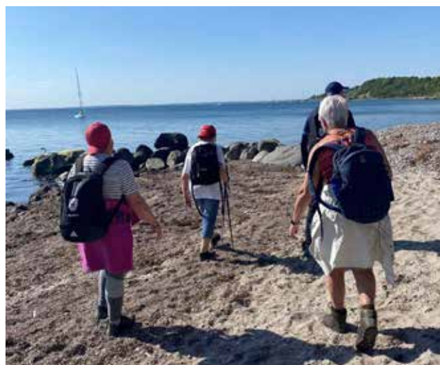
En del av vandringen gick ner till stranden.