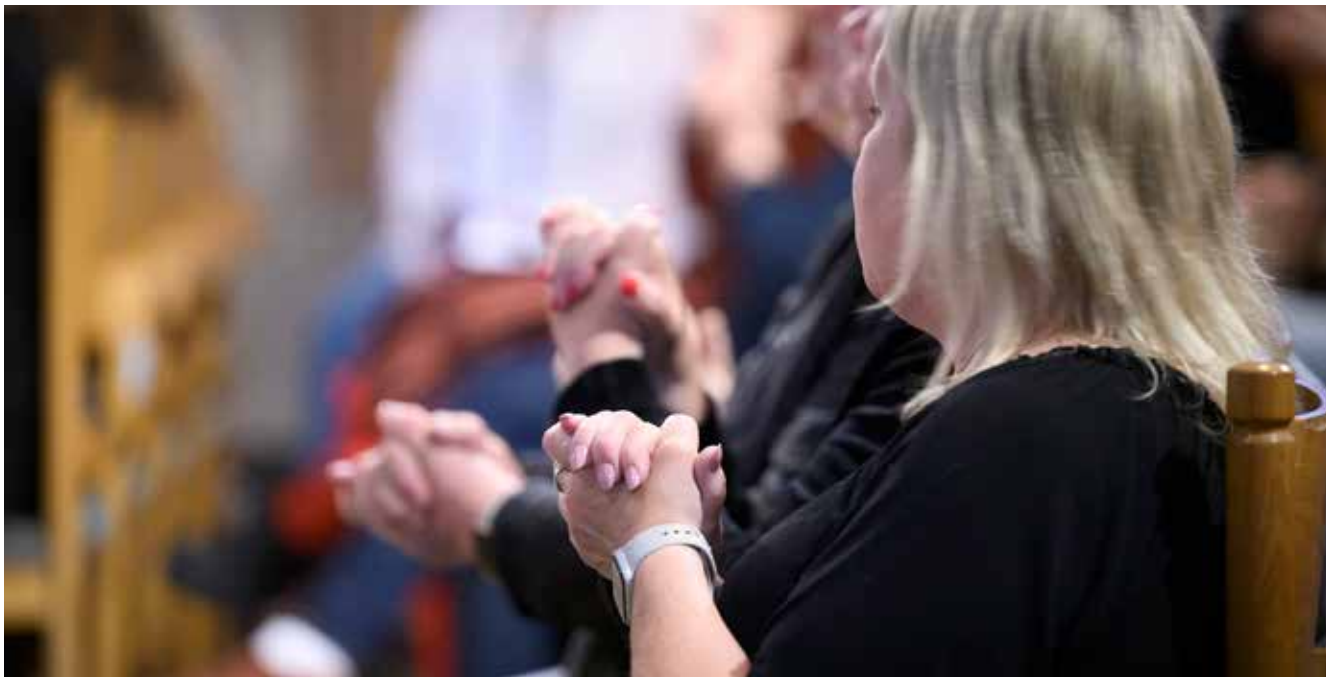
Församlingen tecknar tillsammans i gudstjänsten.