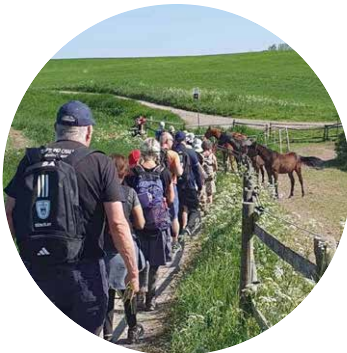
En del av vandringen gick bredvid en hästhage.

Vandringen fortsatte och nu kunde vi ha ett lugnare tempo, Långsamhet. Särskilt i jämförelse med alla cyklar, bussar och bilar.