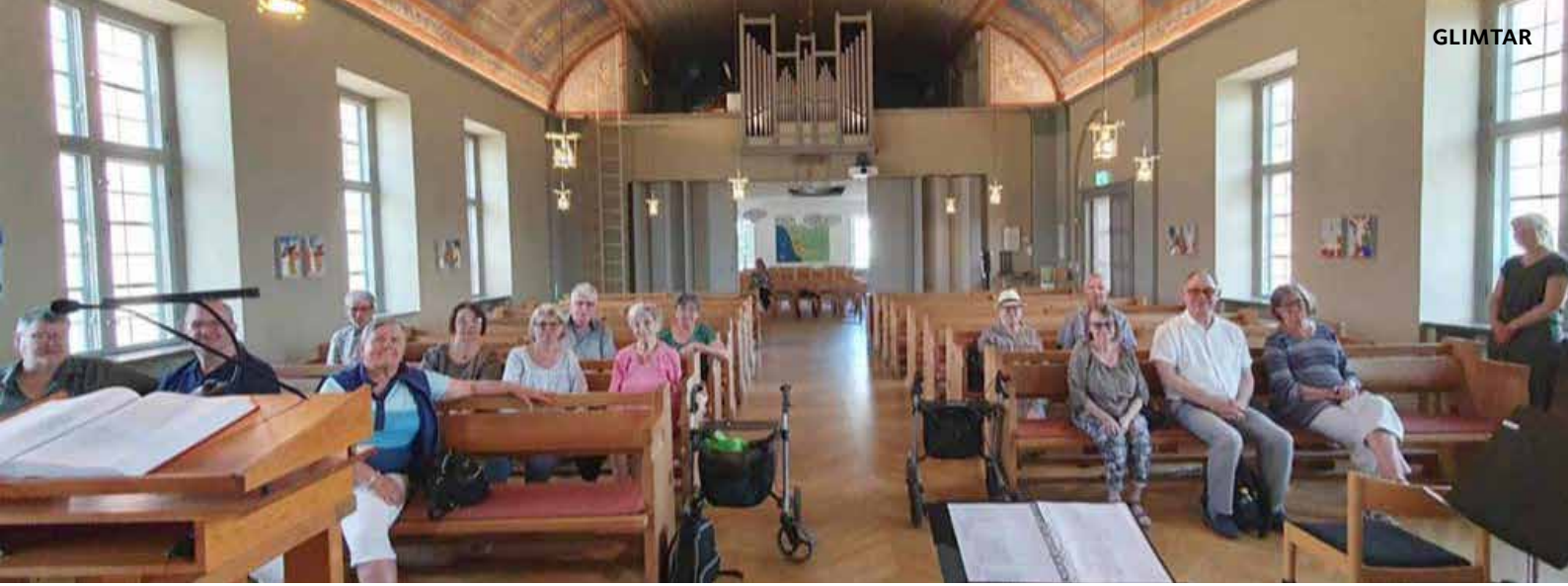
Den 21 maj firade vi lunchandakt i Allhelgonakyrkan på Råå.