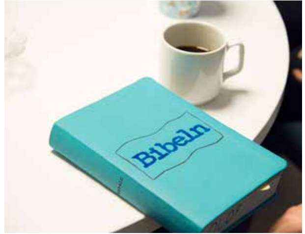
En turkos bibel och en vit kaffekopp på ett vitt bord.