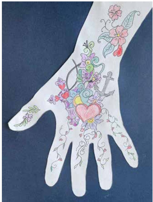
Rita av din hand. Måla valfritt mönster. Klipp ut. Limma fast pappershanden på ett papper i en annan färg.