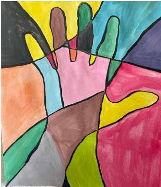
Rita av din hand. Dela in pappret i olika delar och måla i olika färger.