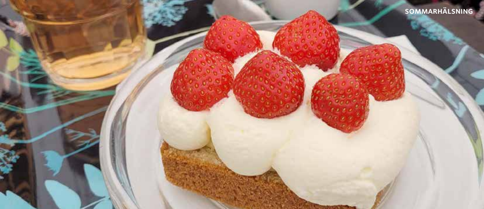
En bakelse med jordgubbar och grädde.