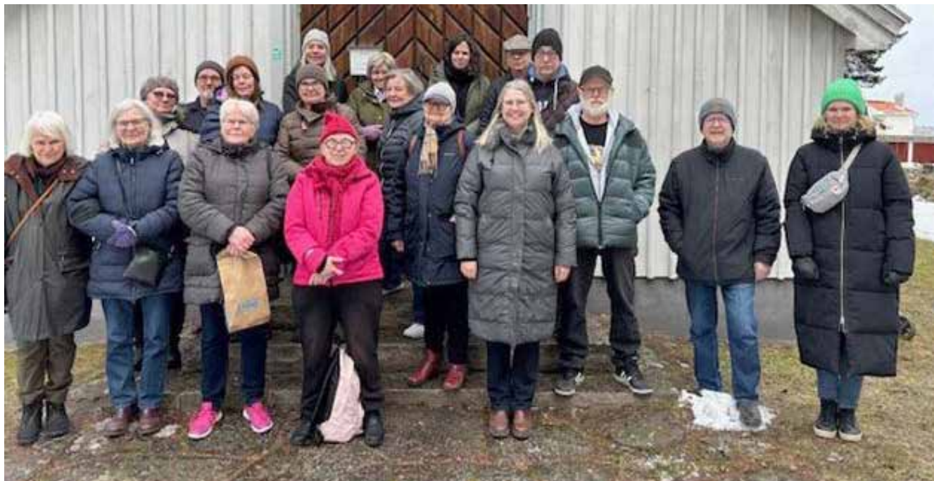
Alla gruppdeltagare står utanför dörren till Kapellet i Böna. Kapellet är ljusgrått och dörren in är i mörkbrunt trä. Nästan alla deltagare har mössa på sig och lite, lite snö finns kvar på marken.