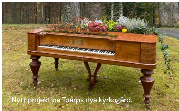
Nytt projekt på Toarps nya kyrkogård.

Kyrkogården är en viloplats där ett lugn ska råda utan massa trafik. När vi vaktmästare är ute och arbetar kan vi väsnas ganska ordentligt emellanåt men det är vårt arbete att sköta om kyrkogården och vissa maskiner låter och väsnas. Så vi ber er snällt för att skapa en lugn viloplats, att inte köra in på kyrkogården om ni inte måste och behöver.