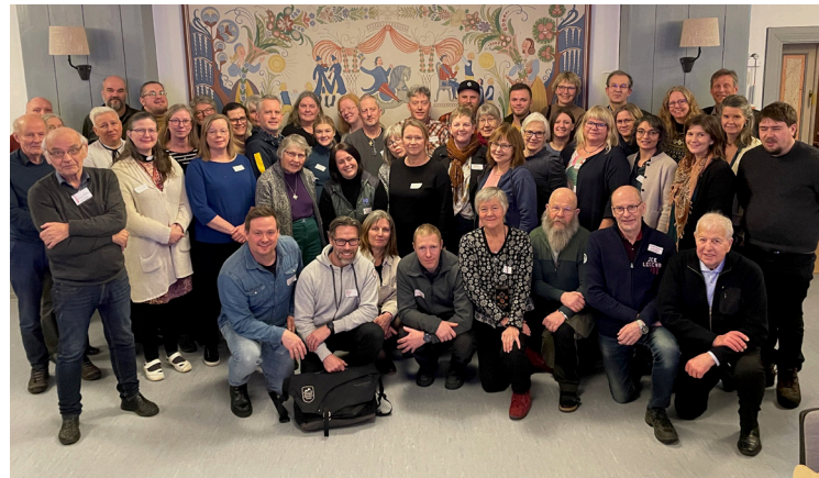
Ledansvariga samlas på stiftsgården Rättvik den 7-8 november.

• Marykedjan främjar god hälsa och socioekonomisk hållbarhet genom samverkan mellan civilsamhälle, myndigheter och näringsliv. Alla insatser utgår från individens hela livssituation och bidrar till positiv utveckling för människor och lokalsamhällen. Projekt kopplade till Marykedjan finns på många platser i landet och medfinansieras av EU.