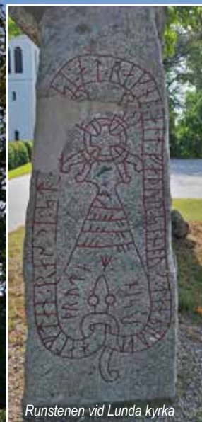
Runstenen vid Lunda kyrka

Den nuvarande kyrkans exteriör är inte ens 250 år gammal. Grunden är nästan 1000 år. Och hur länge platsen använts som helig mark för människor vet vi inte säkert. Men det är inte helt orimligt att anta att det är ungefär lika länge som människor bott i Kiladalen.