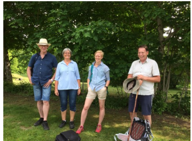
Bild 8: Pilgrimsgudstjänst i Hasselbackarna, Floby 2020-2023