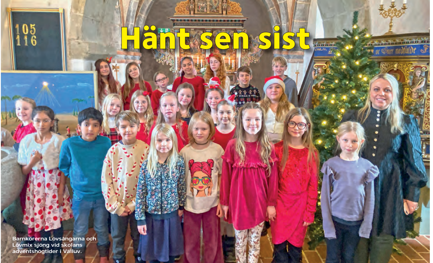
Barnkörerna Lövsångarna och Lövmix sjöng vid skolans adventshögtider i Välluv.