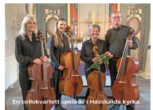
En cellokvartett spelade i Hässlunda kyrka.