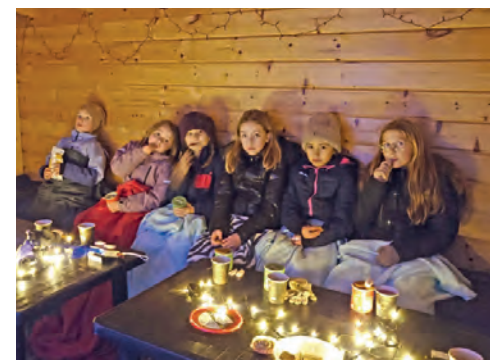
Barnen trivs i Vildmarks kyrkan i Välluv.