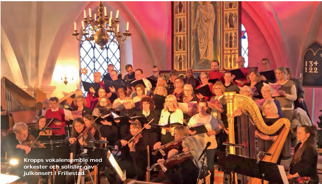
Kropp's vokalsemble med orkester och solister gav julkonsert i Frillestad.