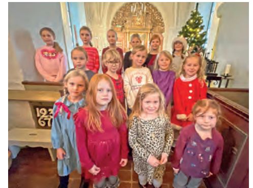
I Mörarp sjöng Sångfåglarna och Sängmix.