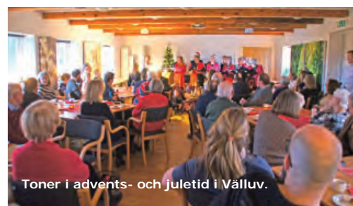
Toner i advents- och juletid i Välluv.