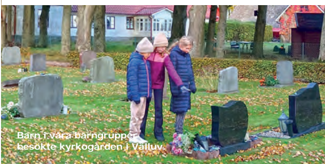
Barn i våra barngrupper besökte kyrkogården i Välluv.