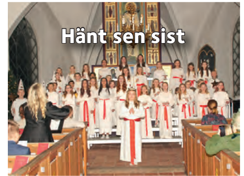
Hänt sen sist