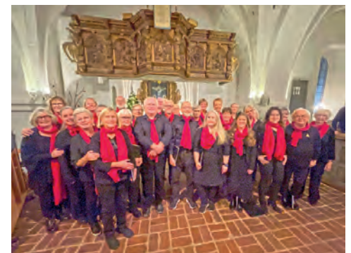
Björkakören gav en adventskonsert i Kropp.