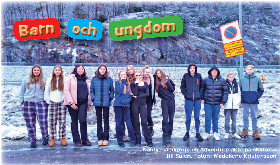
Konfirmandgruppen Adventure åkte på skidresa till Sälen.