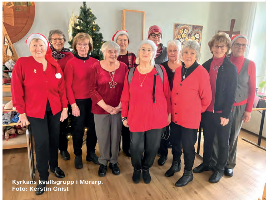
Kyrkans kvällsgrupp i Mörarp.