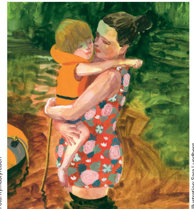
Illustration: Sara Lundberg