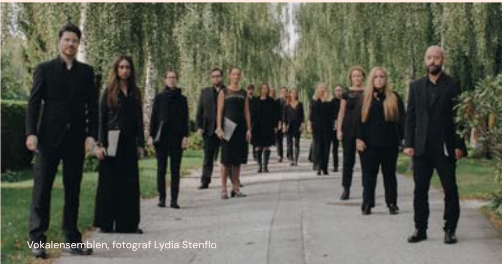
Vokalensemblen

Poulenc har sin text från den franska surrealisten Paul Éluard som skriver frihet på vartenda ting. Det skrevs under andra världskriget som en vision för frihet och bort från krigets tyranni. Båda styckena tillhör a cappella-litteraturens mest komplicerade att sjunga.