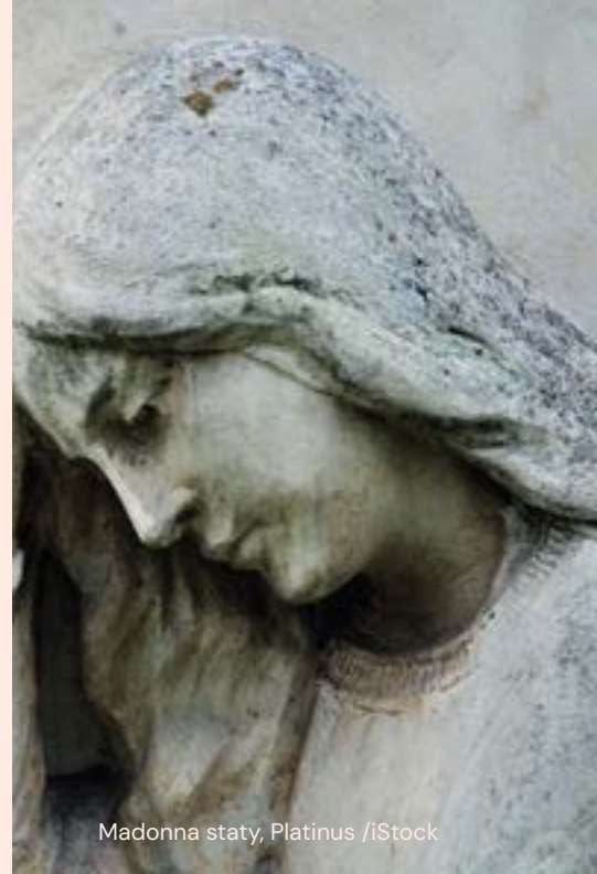
Madonna staty

.. sista raderna från dikten Den levande Maria ur samlingen Karavan av Ebba Lindqvist