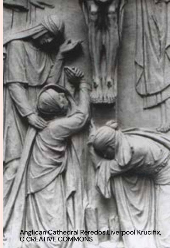
Anglican Cathedral Reredos.Liverpool Crucifix