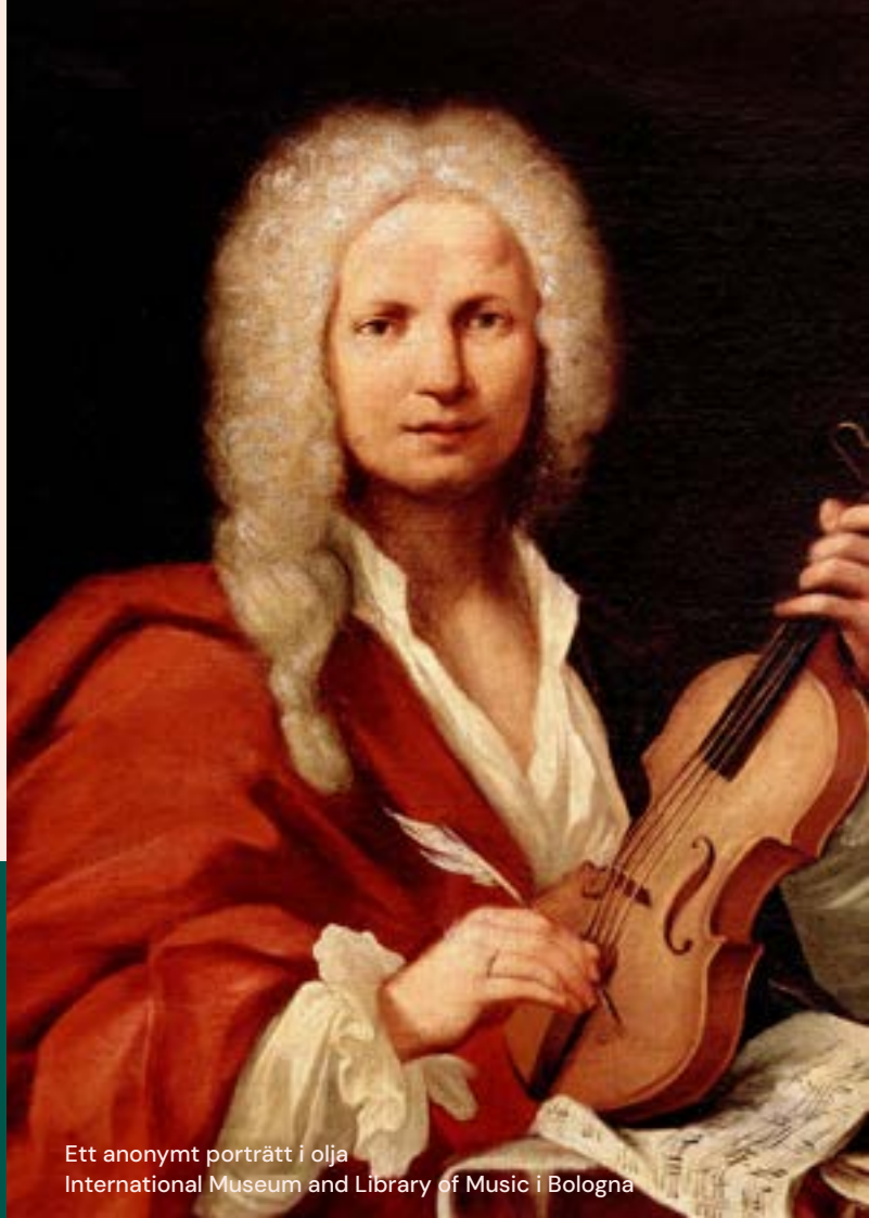
Ett anonymt porträtt i olja International Museum and Library of Music i Bologna