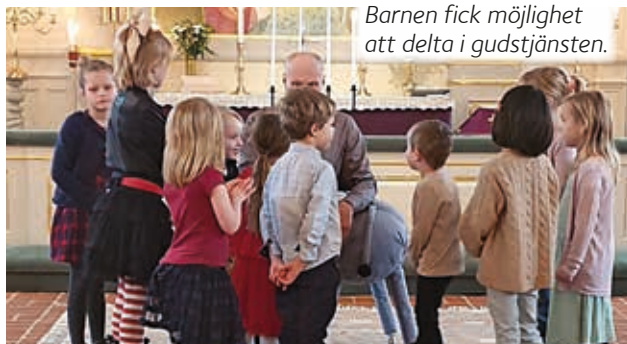
Barnen fick möjlighet att delta i gudstjänsten.