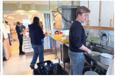
Konfirmanderna anordnar kyrkkaffe tre gånger under läsåret och detta var deras andra omgång. De får själva baka, införskaffa vinster och sköta lottförsäljningen, servera, och till slut sköta disk samt efterstäd. Intäkterna går till deras lägerverksamhet.