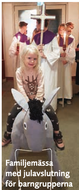
Familjemässa med julavslutning för barngrupperna