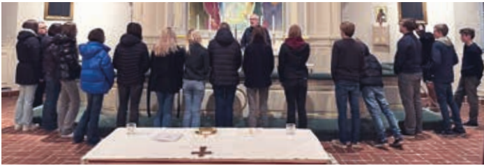
Inför advent är det dags att förbereda sig för att fira nattvard. Efter undervisning får den som vill delta i nattvardsfirandet i gudstjänsten. ThG