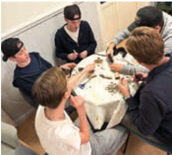
Konfagänget får träna upp sina färdigheter med pyssel.