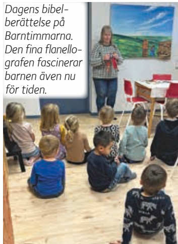
Dagens bibelberättelse på Barntimmarna. Den fina flanellografen fascinerar barnen även nu för tiden.