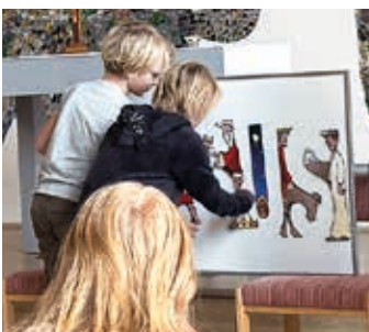
Miniorerna tycker att det är spännande när man får hjälpa till under andakten.