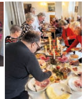
SOPPLUNCHERNA i Rydaholm och Horda är mycket uppskattade. Vid senaste tillfället bjöds det traditionsenligt in till julbord på båda ställen. Gästerna var många och maten hade en strykande åtgång. Nu är vårens soppluncher igång så alla hälsas välkomna att avnjuta de goda sopporerna och få en stunds gemenskap.