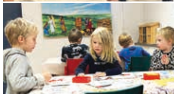
Efter berättelsen väntar pyssel.