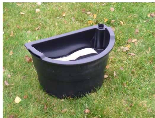
Bildexempel på 48 x29 cm, halvrund planteringslåda.